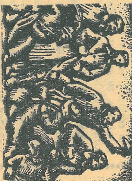
MANISZER: „1905” DOMBORMŰ

JANUÁR 22-e az első orosz polgári forradalom kezdete. 1905-ben ezen a napon (VERES VA-SÁRNAP) Gapon pópa, cári ügy- nek és provokátor, a pétervári Téli Palota előtt munkásünnepet szervezett. Az összegyűlt tömegbe a cári csapatok beleséttek és a helyszínen több, mint 1000 halott maradt.