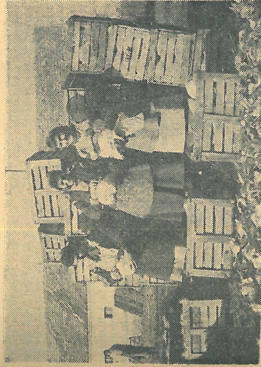
Dolgozik a lány-brigád.