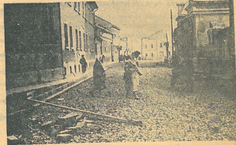
Még kényelmetlen a járás az Arany János utca új burkolatán. Ha majd véglegesen elkészül, egyenes út köti össze a várost Kisapátni keresztül a balatoni műúttal