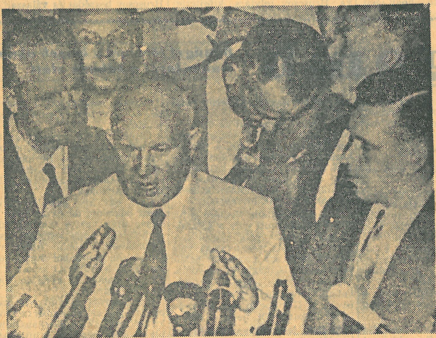
Hruscsov elvtárs a mikrofon előtt a szenátus külügyi bizottságának szeptember 16-i ülésén. Jobbról a tolmács, mögötte W. Fullbright szenátor, a külügyi bizottság elnöke

megszüntetése; a rakétakilövő berendezések megsemmisítése; a hadiipari termelés megszüntetése; a katonai szolgálat minden fajtájának és a katonai kiképzés minden fajtájának megszüntetése; a hadügyminisztériumok, a vezérkarok, az összes többi katonai szervek, szervezetek és intézmények megszüntetése; bármilyen forrásból eredő mindennemű katonai kiutalás megszüntetése; a háborús propaganda és az ifjúság katonai szellemű nevelésének betiltása; olyan törvények kiadása, amelyek büntetést helyeznek kilátásba a felsorolt pontok bármelyikének megszegése esetén. Az államok rendelkezésében csupán az együttesen megállapított rendőri kontingensek maradnak a belső rend fenntartására, és az állampolgárok személyi biztonságának megvédésére. (MTI)