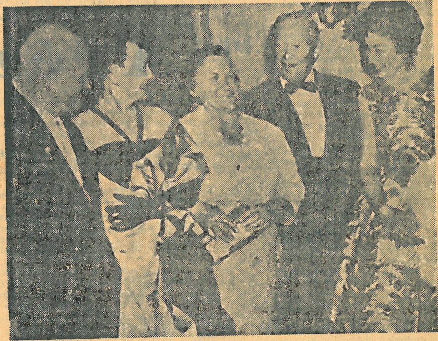
Hruscsov, Eisenhower, feleségük, és Eisenhower menyéje a szeptember 16-án este, a szovjet nagykövetségen megrendezett vacsora előtt beszélgetnek (AP-LONDON telefotó)