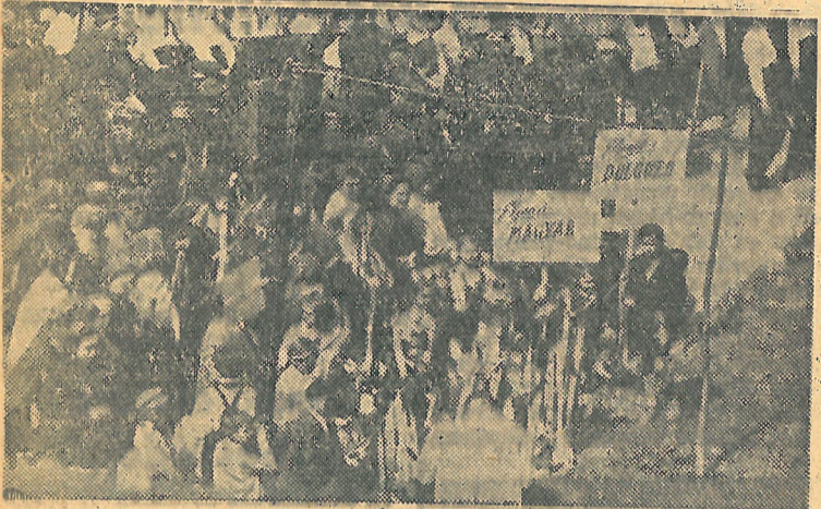
Anyák és gyermekek a menetben.