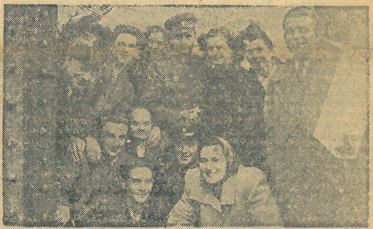
Környökbánya és Várpalota küldöttsége