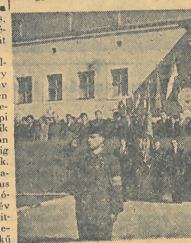
A várpalotai iparmedence zászlót adományoz a munkásörzészlőnek

— Több biztosíték is van erre. — Az 1918-19-es időkkel szemben ma már nem állunk egyedül, velünk vannak a többi szocialista államok, élükön a hatalmas Szovjetunióval, a 600 millió Kínával. A kínai elvtársak ezt így fogalmazták meg: „Egy szocialista országot ma már csak akkor lehet megsemmisíteni, ha elszakad a szocialista tábor központjától, a Szovjetuniótól.”