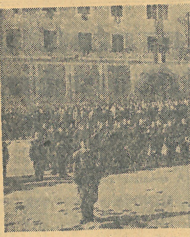
A felsorakozott munkásörzészlő

hasámat, népemé, ha kell életem feláldozásával is megvédem. ... Ha pedig eskümet megszegem, sújtsan a Népköztársaság törvénye, pártom, osztályom megvetése. Ezek a szavak arról beszélnek, hogy soha többé nem ismétlődhetik meg Magyarországon 1956. október 23-a.