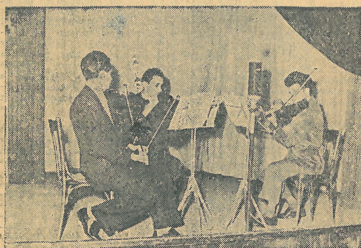
Az egyik népszerű zenekari szám.