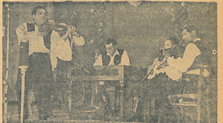
Az együttes zenekara