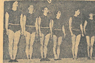
A nagy sikerrel megrendezett tornabemutatóon szerepelt Testnevelési Főiskola és a magyar válogatott női tornászkeret tagjai