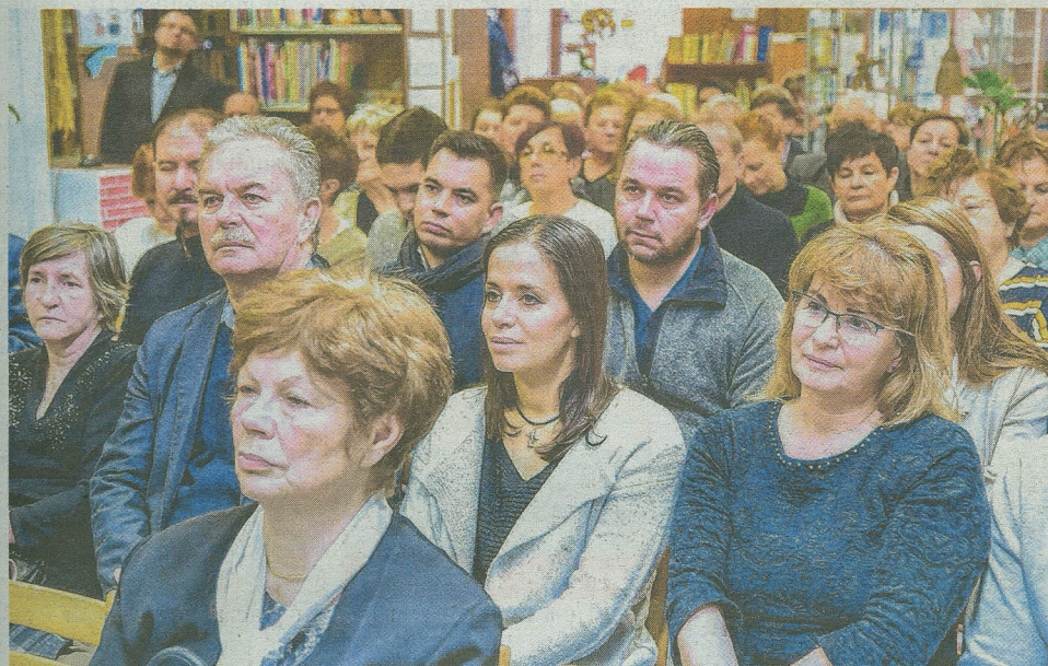
A családtagok mellett az egykori barátok, ismerősök közül is sokan eljöttek a városi könyvtárba