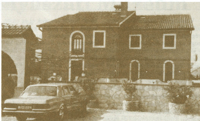
Albatros panzió, étterem – Rovinj, Valbruna 2.