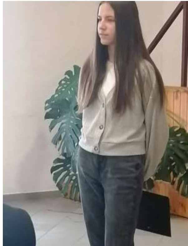
118. Kemenesmihályfai egyetemista versmondó