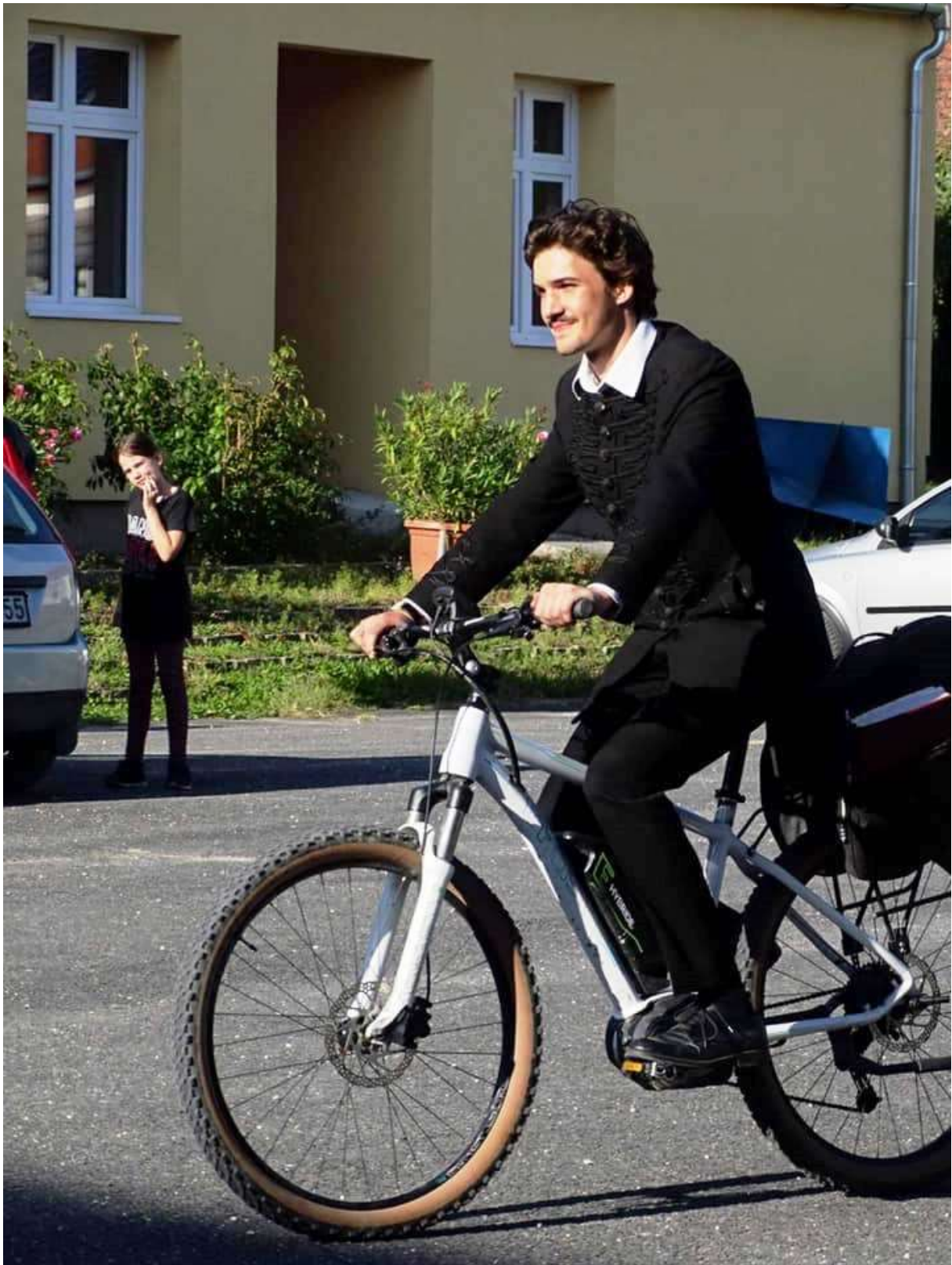
74. "A költő visszatér" - ezúttal Pápára