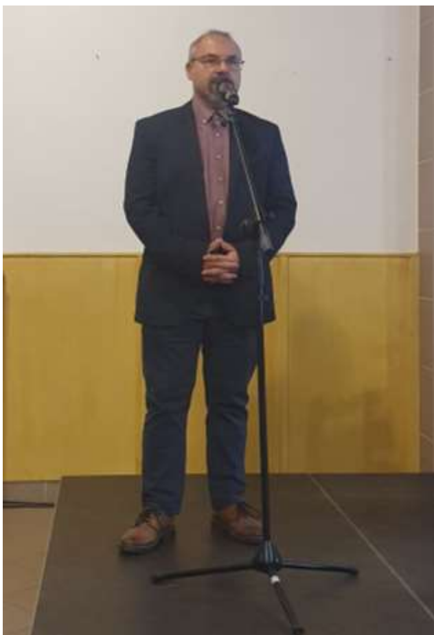
79. A záródoklat céljainak ismertetése