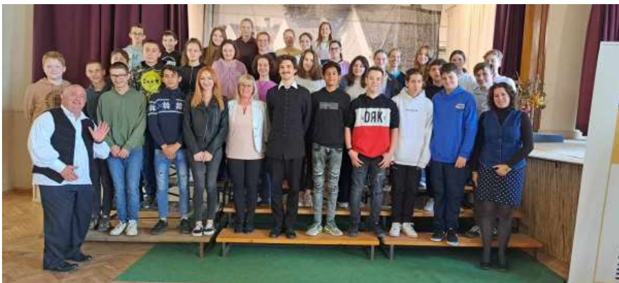
69. A helyi diákokból álló hálás közönség