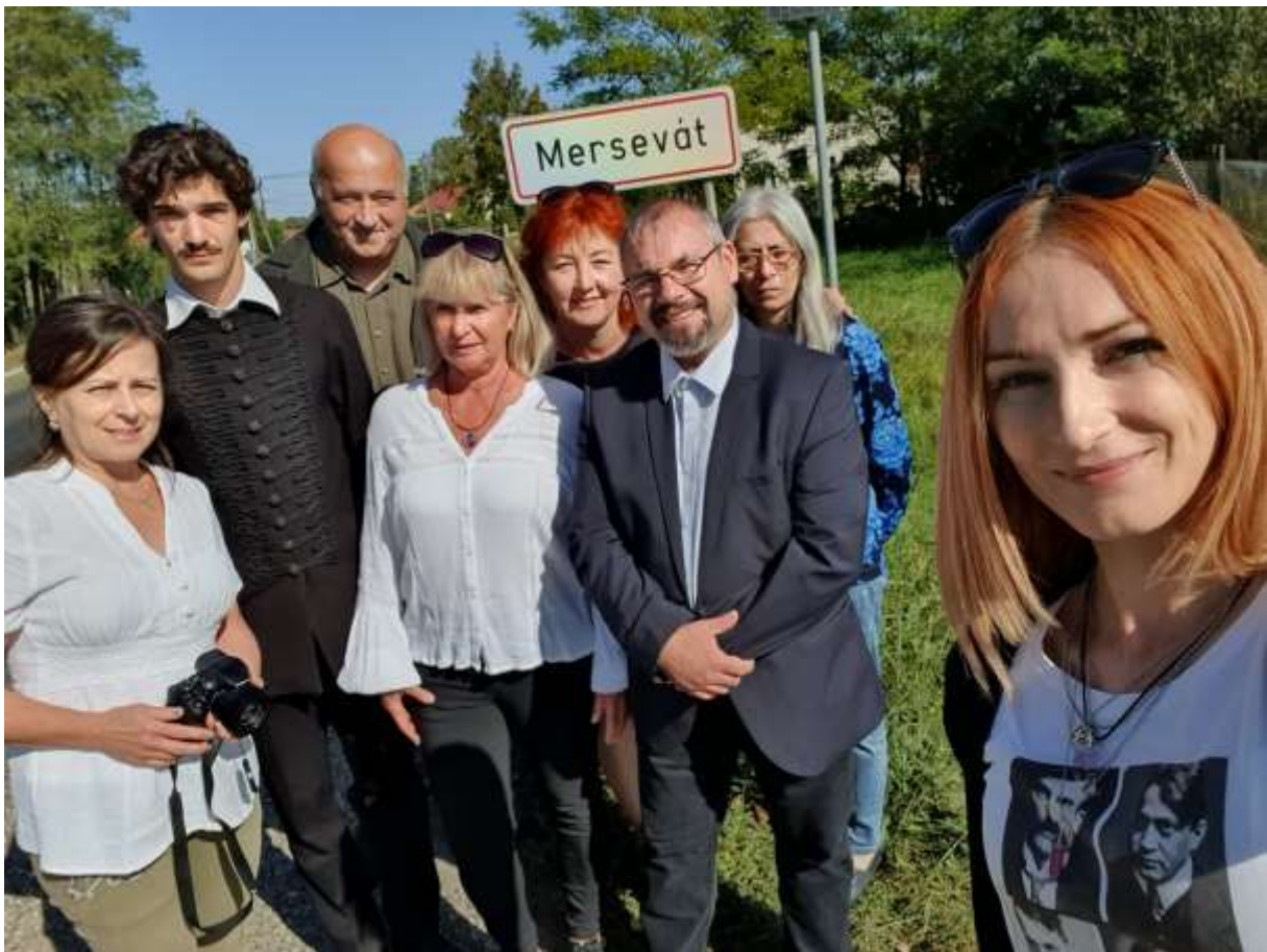
97. Megérkeznek a zárandokok Merseváttra