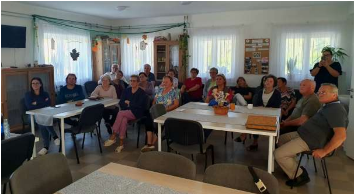
99. A hallgatóság