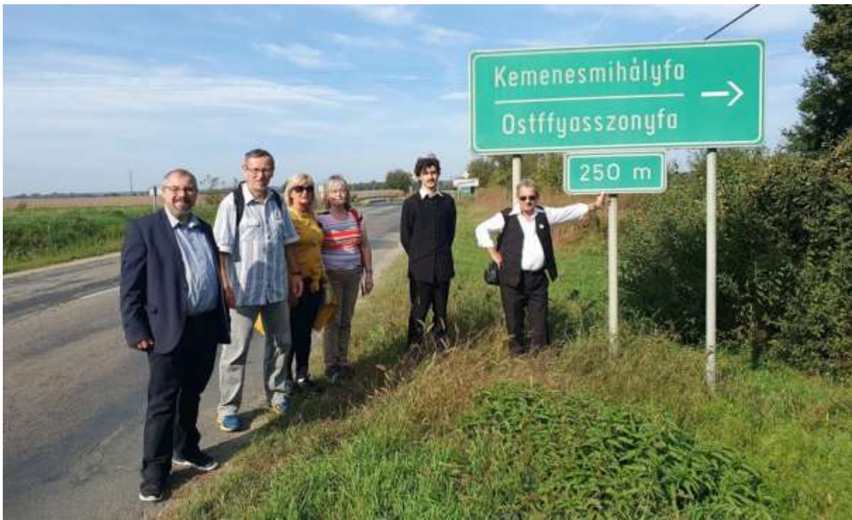
113. A Celdömölkről induló gyalogos túra zarándokai