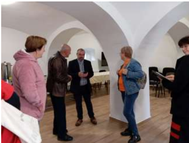
45. Utolsó egyeztetések a helyi program menetéről