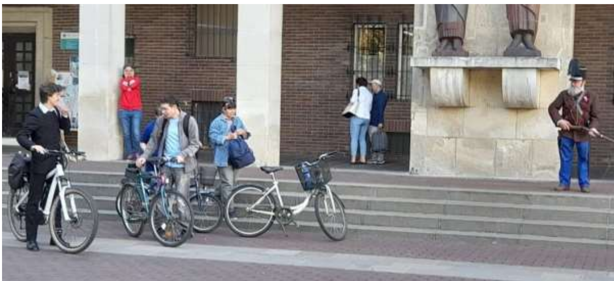
9. Az indulás előtti pillanatok