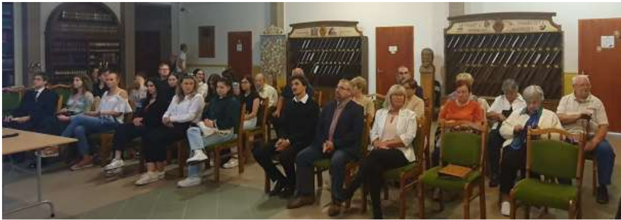
77. A zárándoklatot fogadó közönség