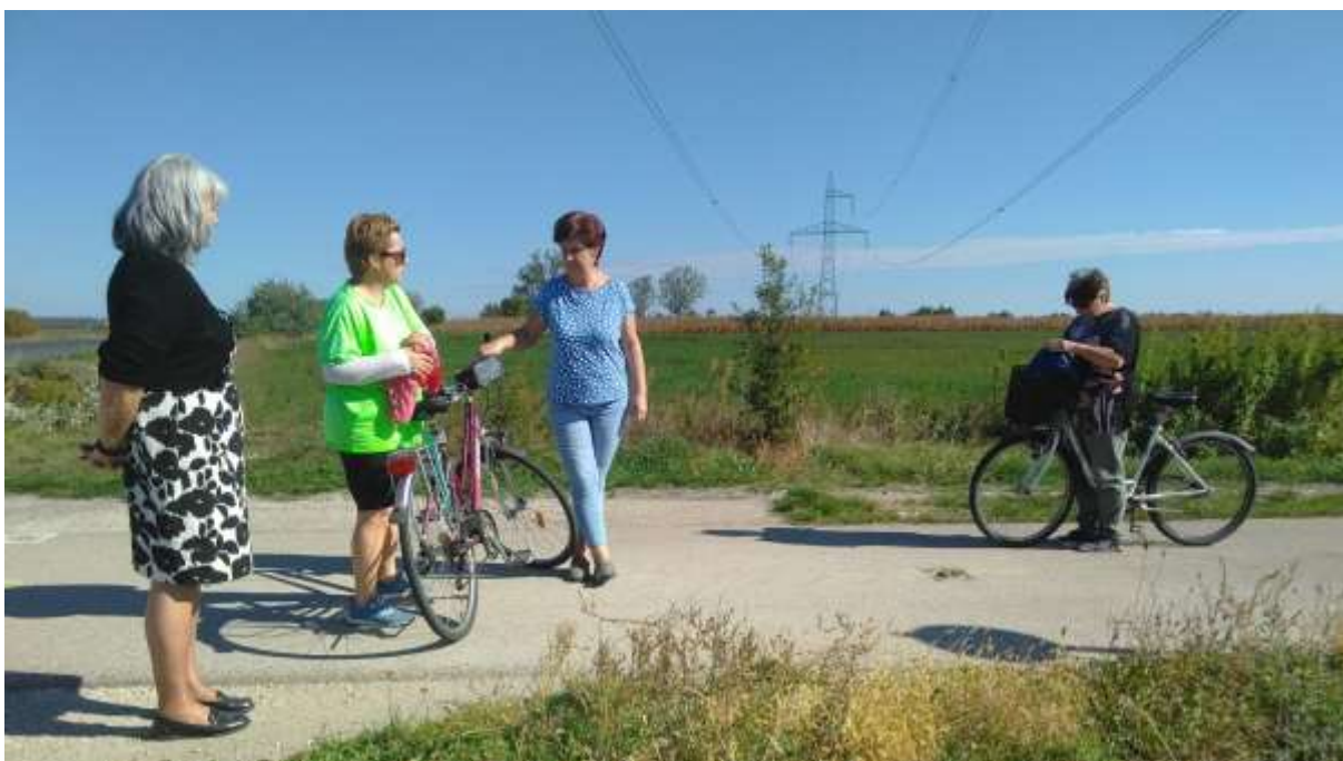
10. A fehérvári könyvtárosok kerékpáros zárandokkülönítménye