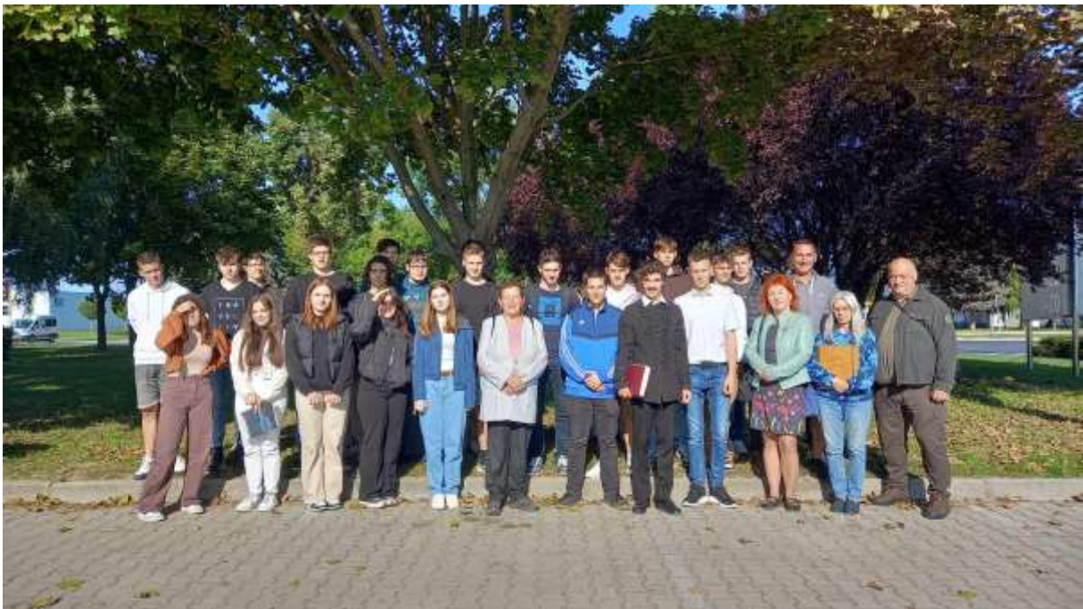
92. Búcsú előtti pillanat Pápán