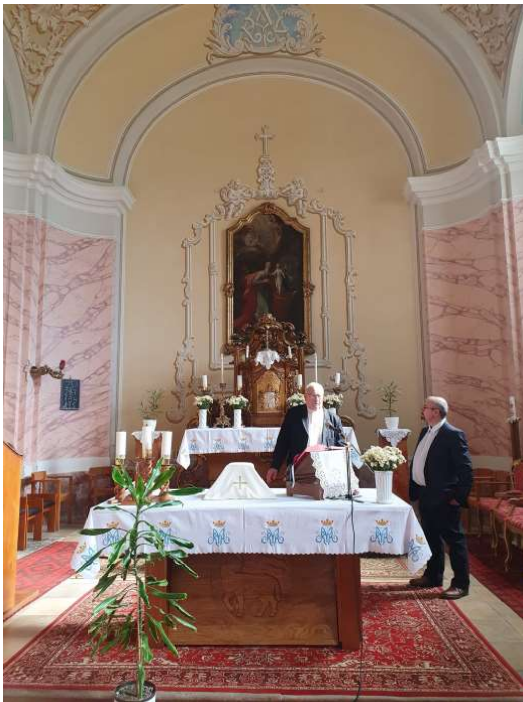
96. A nyárádi templom meglátogatása