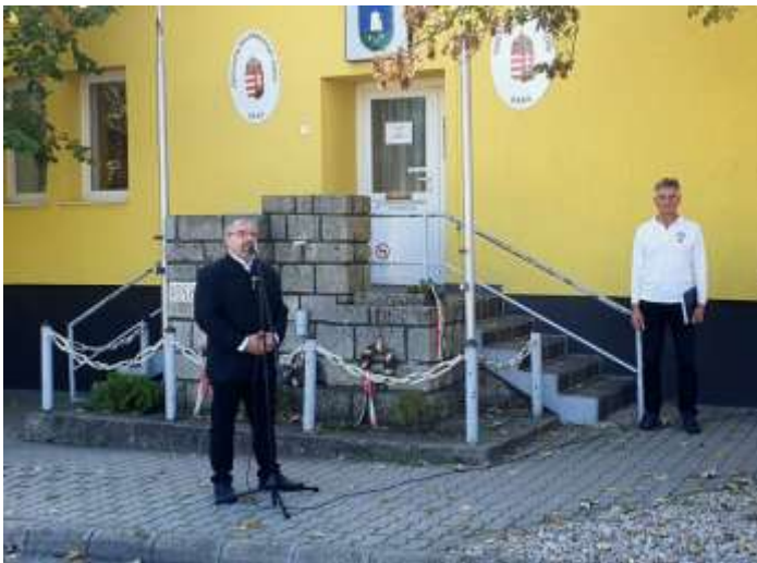
30. A zárandoklat céljának ismertetése Öskүн