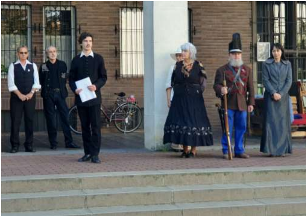
7. „Petőfi Sándor” egyik Székesfehérváron írt versét szavalja