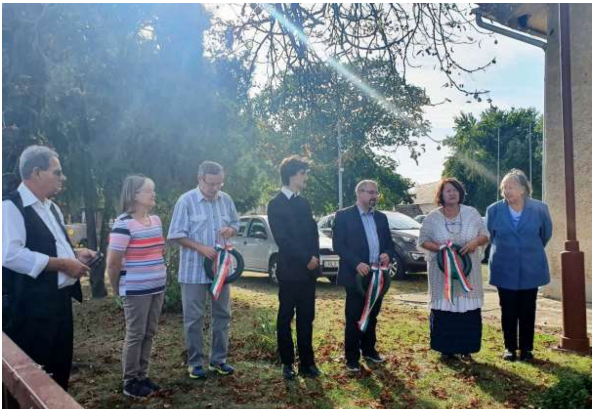
137. A Petőfi-szobor megkoszorúzása előtti pillanat