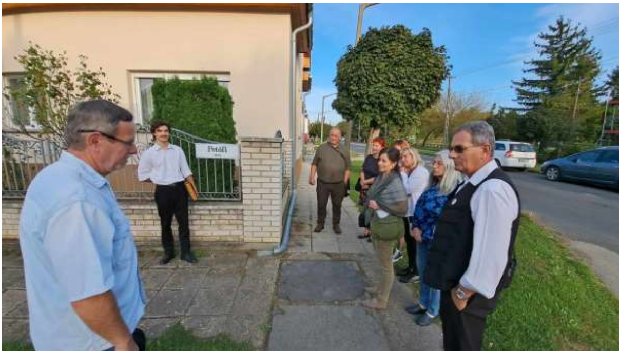
110. A celdömölki Petőfi Sándor utca táblája „Petőfi Sándorral” és a zarándokkal