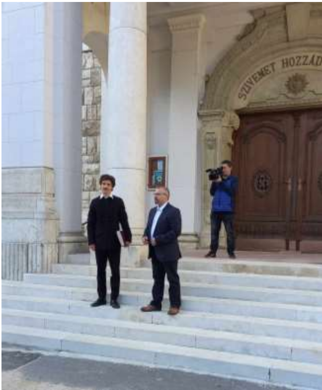
89. A zárándoklat ismertetése a pápai közönségnek