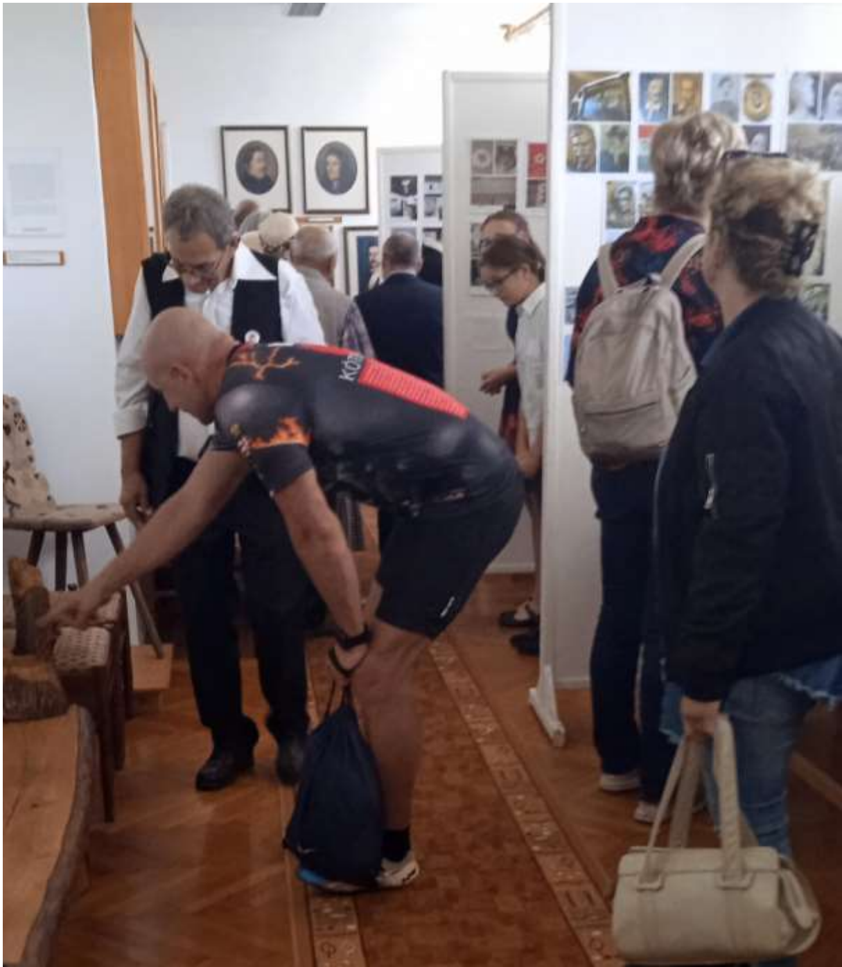
141. Az ostffyasszonyfai Petőfi-kiállítás, a zárandoklat „szent célhelye”. Innen jelentkeztünk be a Kossuth Rádió élő műsorába