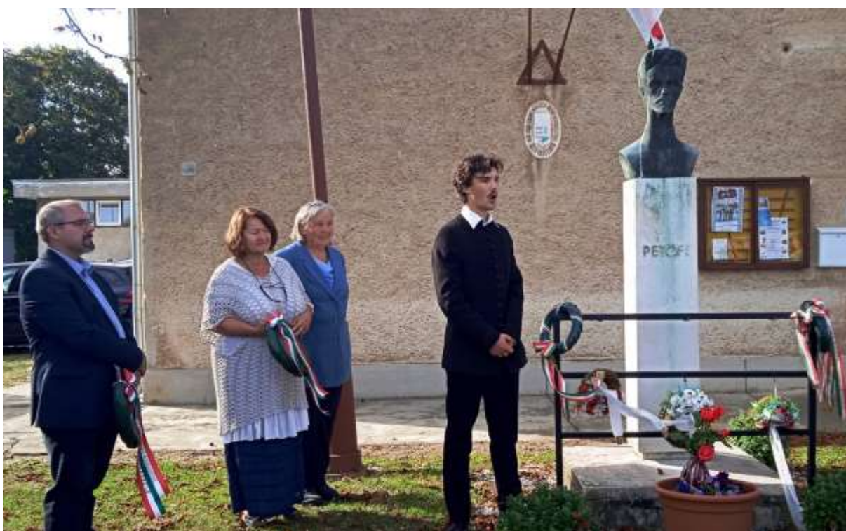
134. A Petőfi-szobornál „Petőfi” szavával