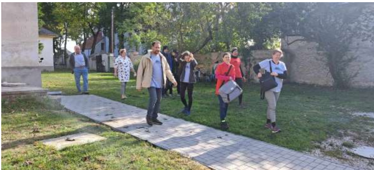
44. Márkóra ér a zarándokok csapata