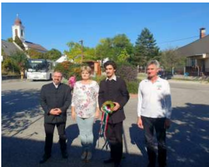
32. Koszorúzás előtti pillanatok