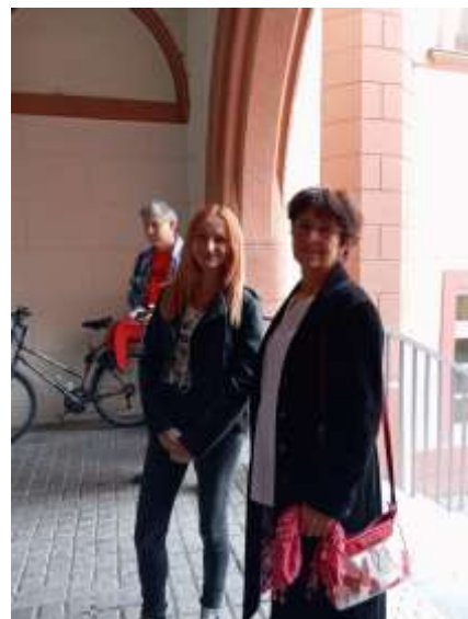
42. Várpalota is képviselteti magát