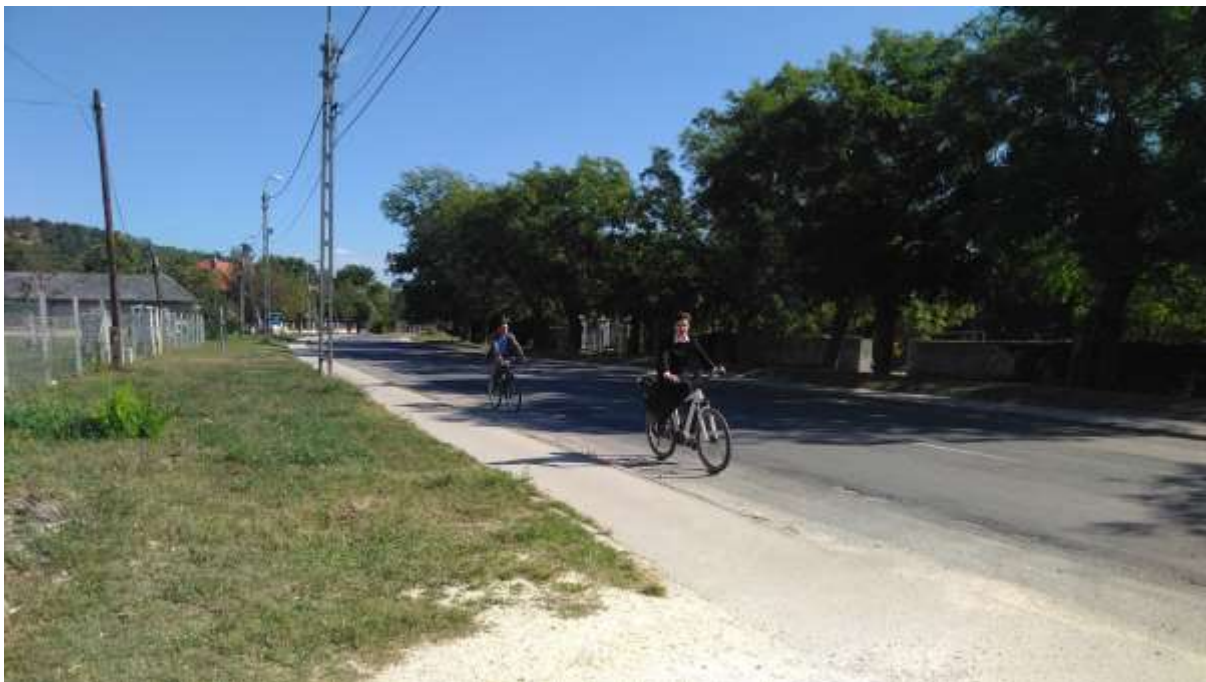
11. „Petőfi Sándor” megérkezik Csórra