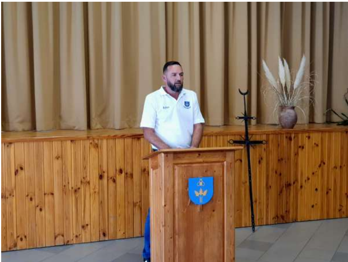
117. A polgármester köszöntője