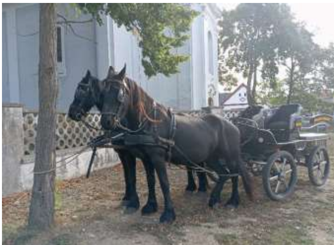
49. A lovaskocsi előállt, hogy „Petőfi” kocsival folytathassa útját