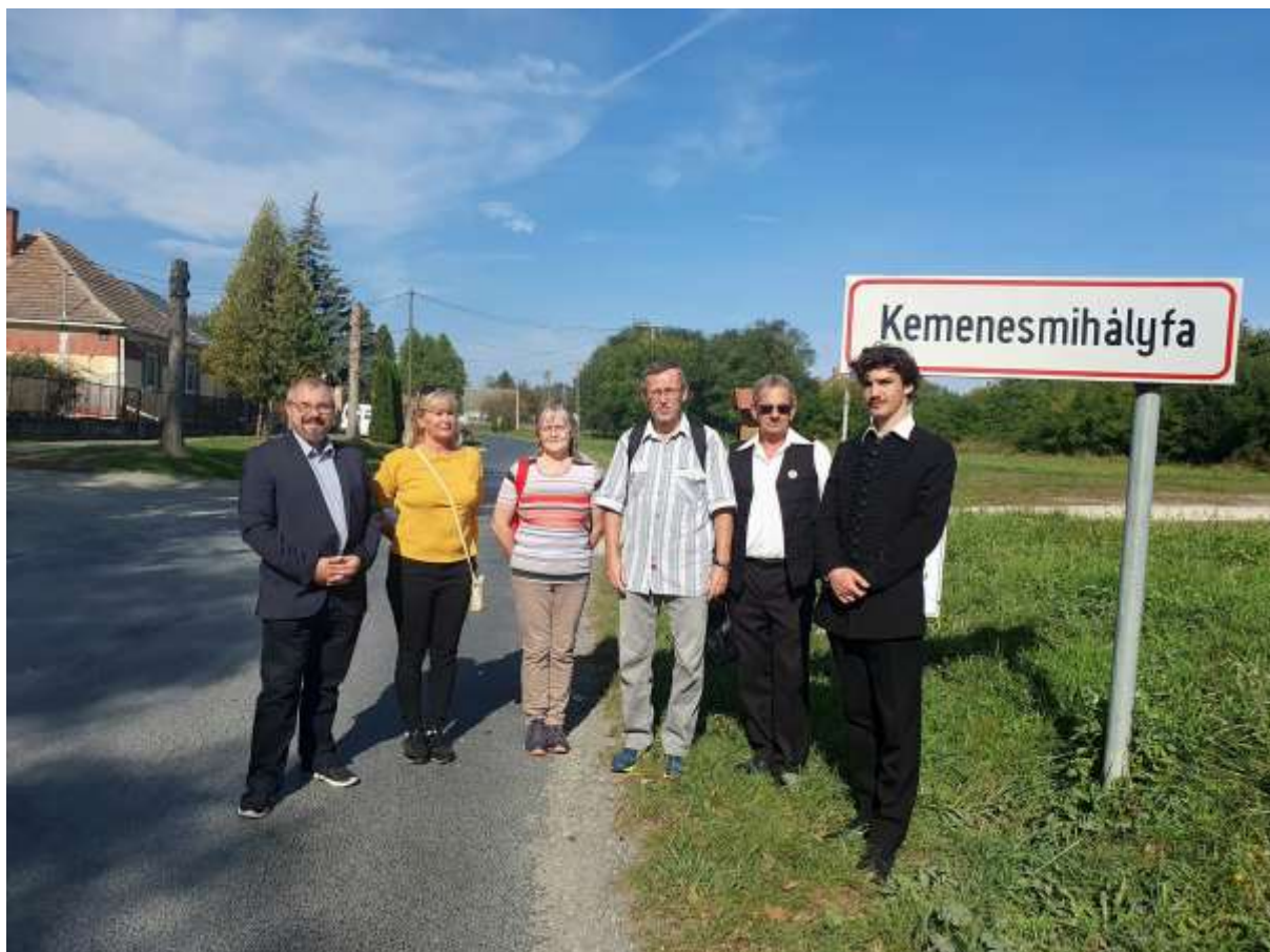
114. Gyalogos zarándokok Kemenesmihályfa táblájánál