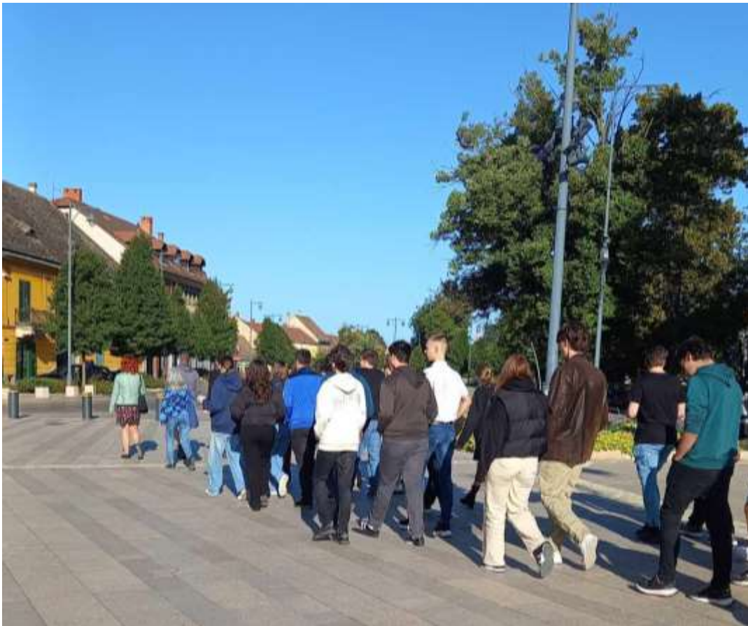
91. A pápai zarándokok a városhatárig kísérik útján „Petőfi Sándort”