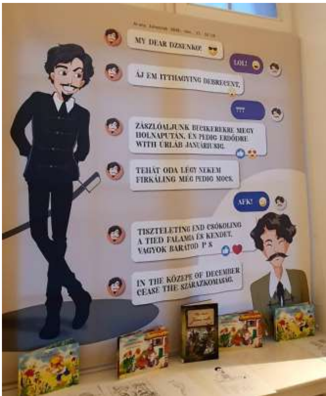
84. A Református Kollégium Petőfi-kiállításának egy része fiatalos nyelvezet használ