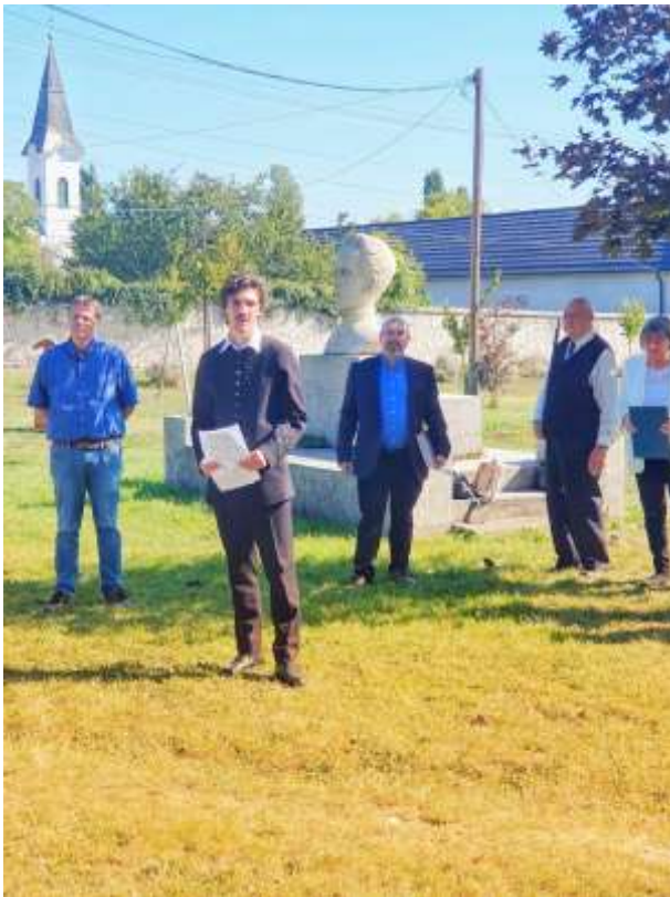
165. „Petőfi Sándor” előadja versét