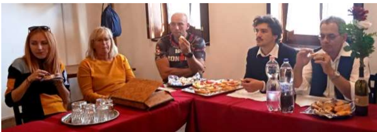
149. A sűrű nap után jól esik az étel