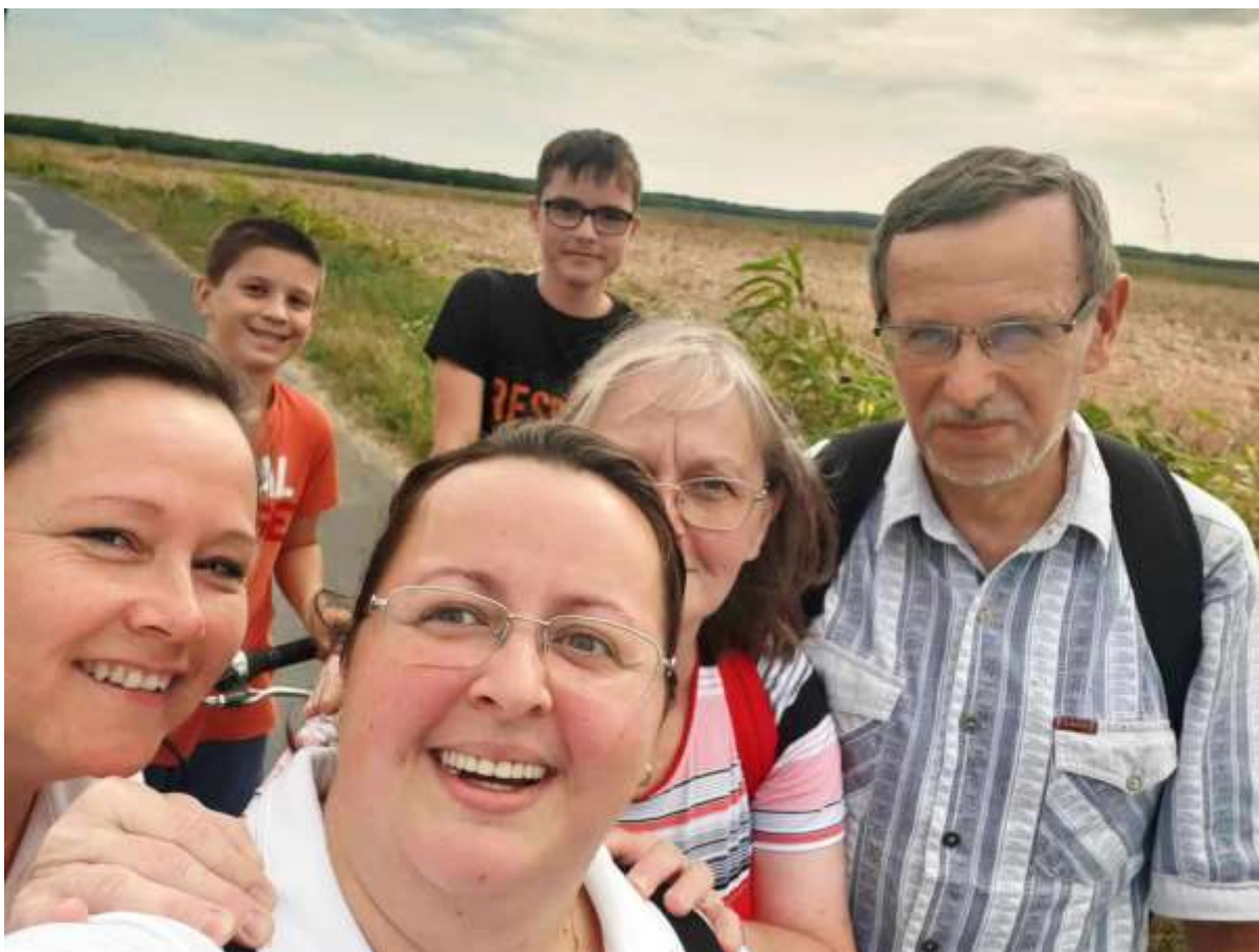
130. A kemenesmihályfai és celdömölki zarándokok