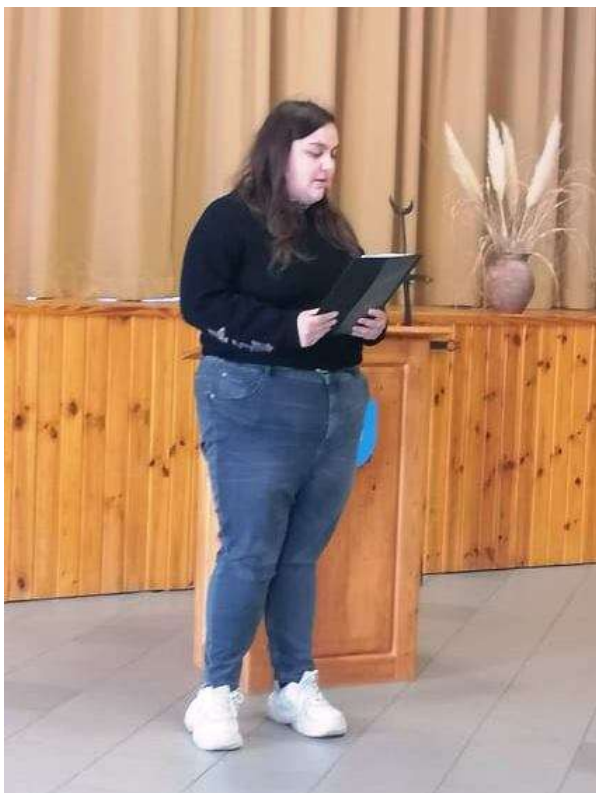
122. Egyetemista versmondó