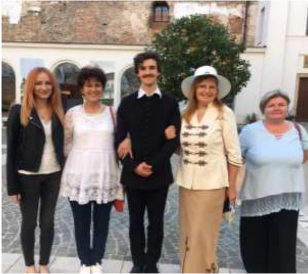
18. „Petőfi Sándor” várpalotai hölgyek koszorújában