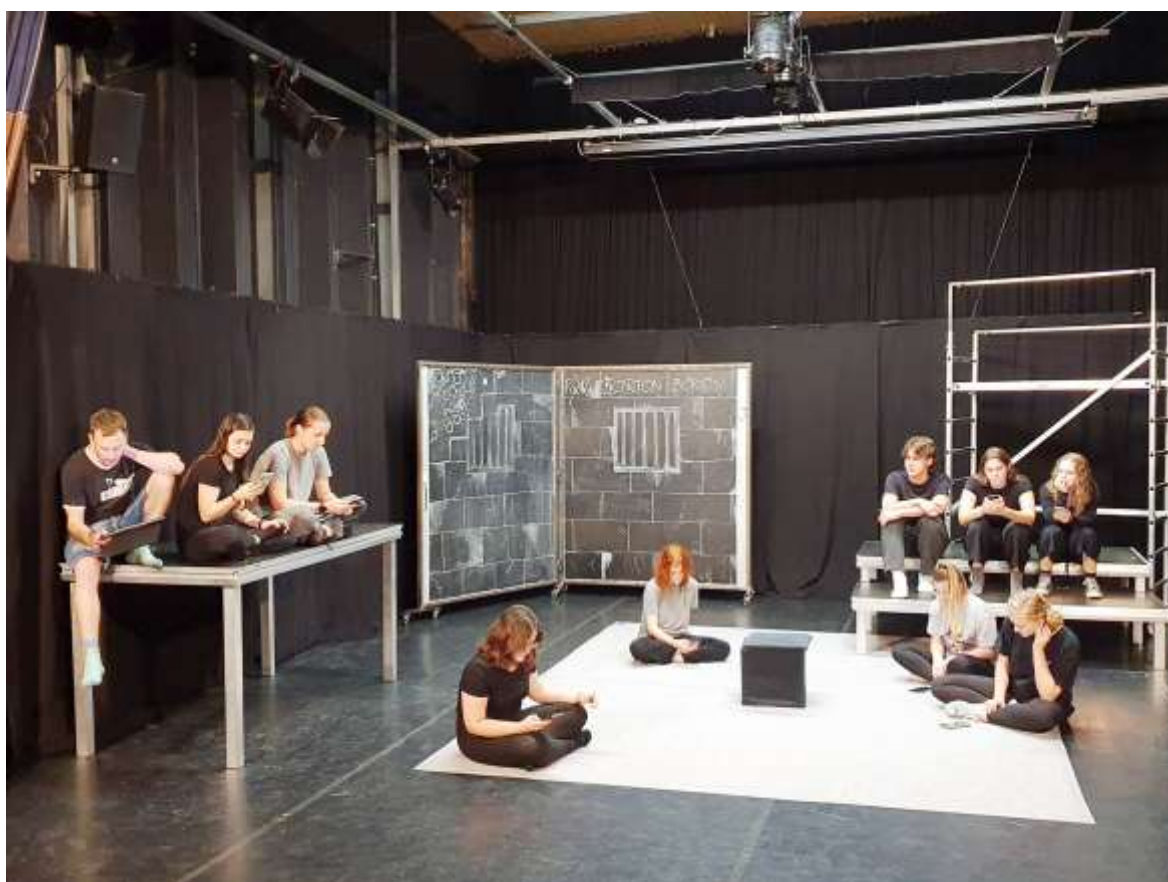
109. Az Apostol próbája, amelyen díszvendégként vehettünk részt