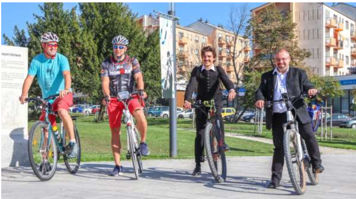
26. Indulás előtti pillanatok