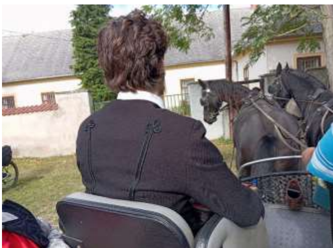
50. „Petőfi Sándor” továbbindul Bándra