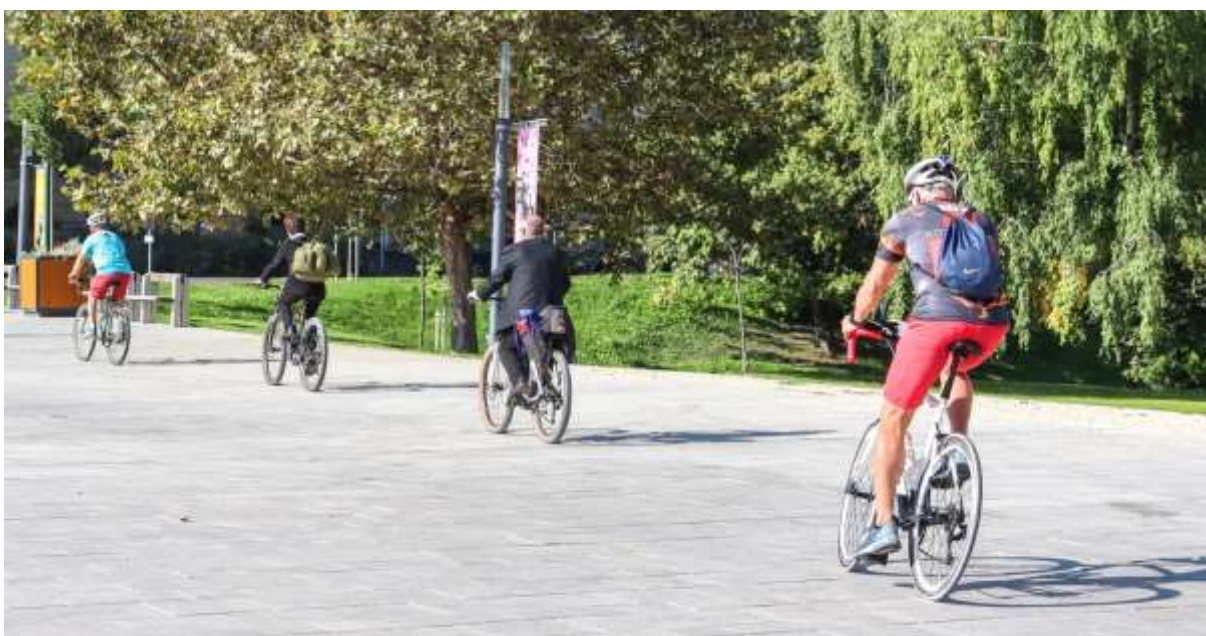
27. Elindul a várapalotai kerékpáros zarándokcsapat