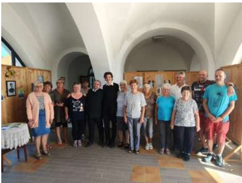
34. Csoportkép: a várapotai és ösküi zarándokok a hajmáskéri vendéglátók körében