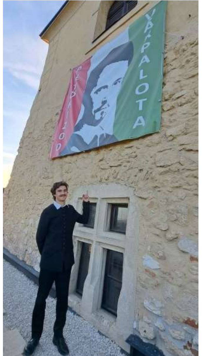
20. „Petőfi Sándor” megszemléli az emlékév várpalotai molinóját