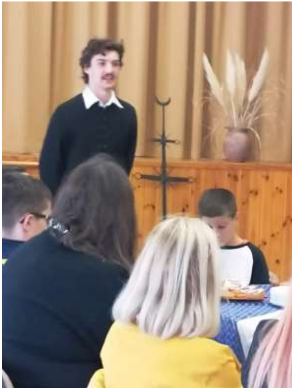
119. „Petőfi” szaval