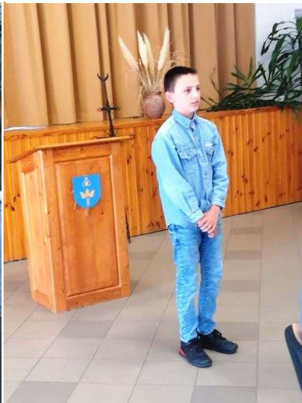
120. Általános iskolás versmondó