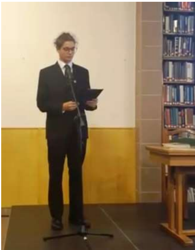
81. Elhangzik Petőfi Vándorlatok költeménye