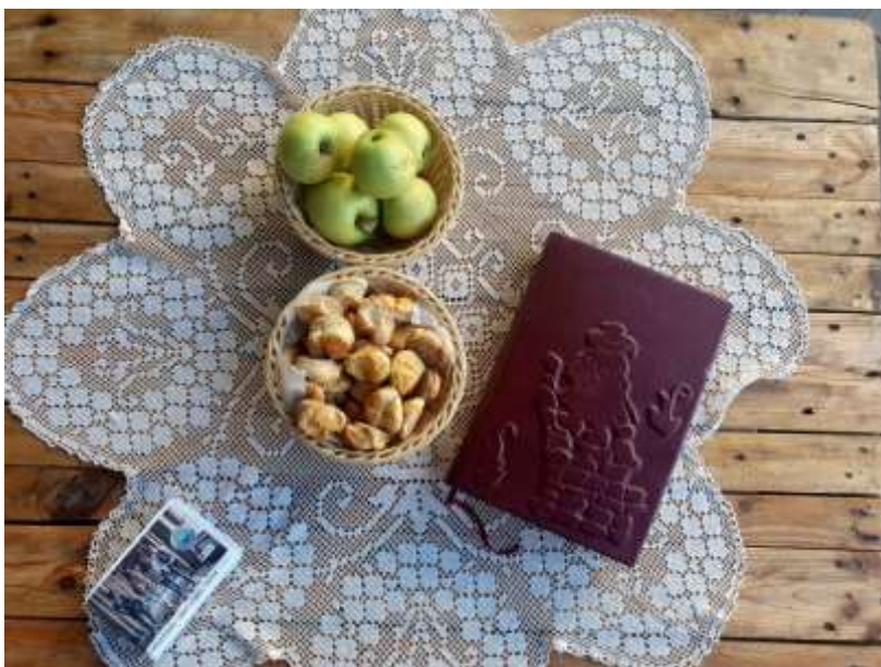
4. A Vándorkönyv útra kész