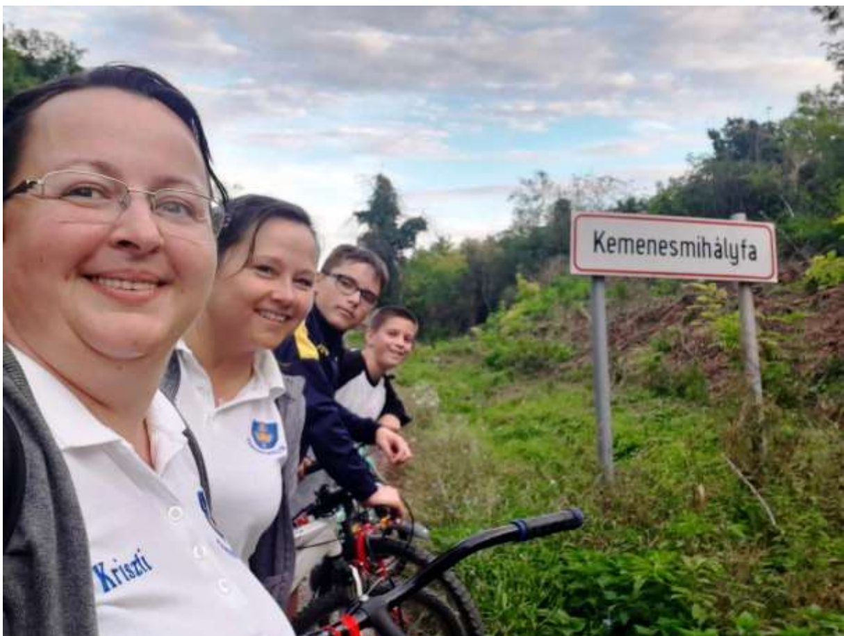
129. A kemenesmihályfai kerékpáros zarándokok