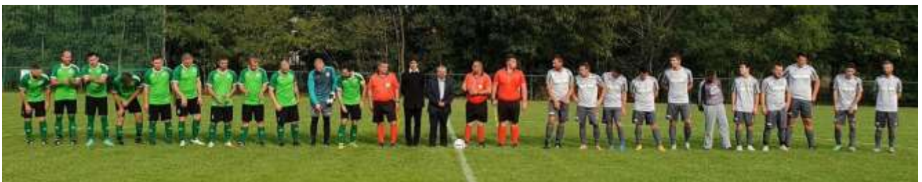
142. Az Ostffyasszonyfa és az ősi rivális, Kenyeri csapata felsorakozott a kezdőrúgáshoz