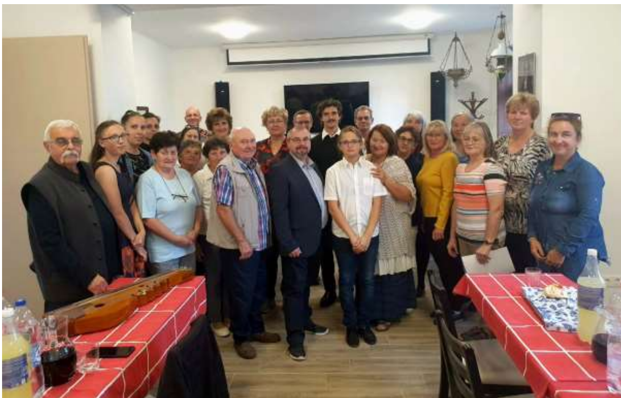
150. Csoportkép a végállomáson, az ostffyasszonyfai parókián