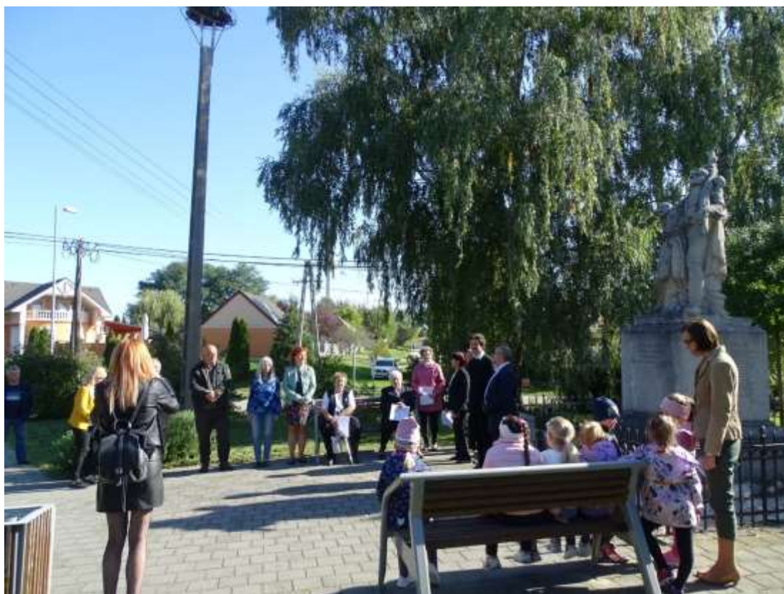
93. A nyárádiak műsora Petőfi Sándor tiszteletére az első világháborús emlékmű előtti téren

A program a katolikus parókiában folytatódott. A plébános úr szeretetvendégség keretében adta át a zárandokcsapatnak szánt üzenetet, Petőfi Sándor Ha férfi vagy, légy férfi című versét. A szövegét kiosztotta fénymásolatban, és a jelenlévők tolmácsolásában el is hangzott a költemény. Ezután az atya a vándorkönyvbe is bejegyezte a verset, Móricz Heténynek pedig egy Petőfi emlékévk tiszteletére kiadott pénzérmével kedveskedett. Miután minden jelenlévő aláírta a könyvet, meglátogattuk a helyi katolikus templomot, ahol a plébános úr Nyárad és a katolikus templom történetéről tartott előadást. Ezzel a tudással felvértezve köszöntünk el Nyárádtól és kedves vendéglátóinktól, hogy továbbhaladjunk Merseváttra.