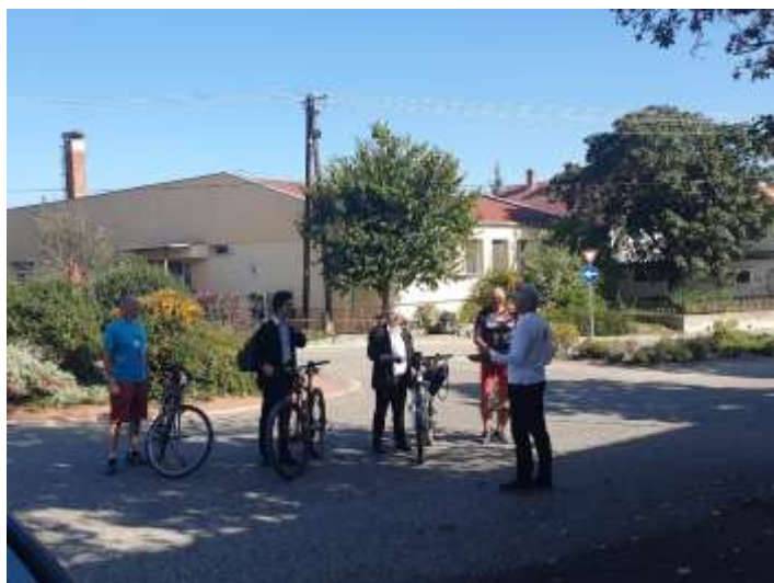
28. A várpalotai kerékpáros csapat megérkezik Ösküre