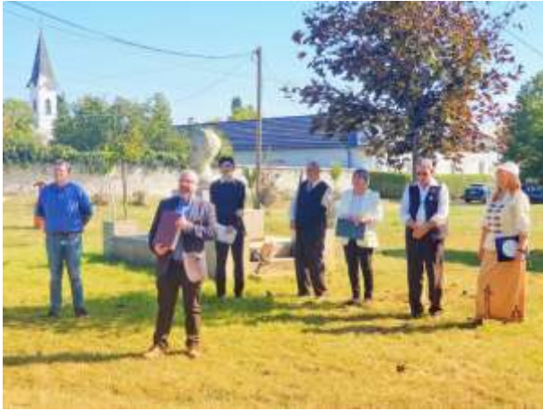
14. A zárandoklat céljának ismertetése zajlik