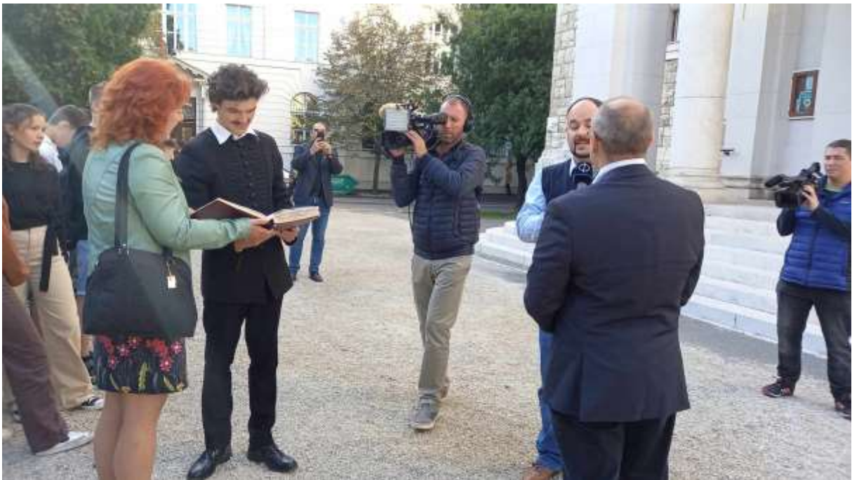
90. Éppen szerepelünk a Magyar Televízió 9 órás híradójának élő műsorában