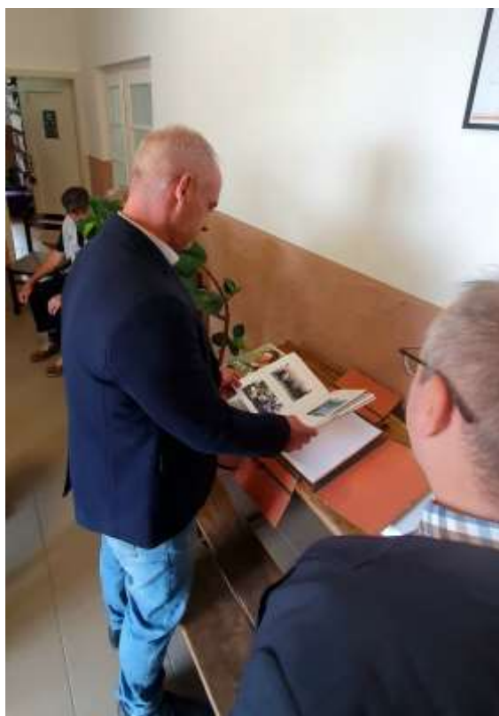
53. Polgármester úr áttekinti a korábbi állomások bejegyzéseit, majd ő is üzenetet ír a vándorkönyvbe