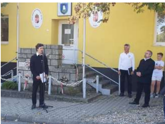
31. „Petőfi Sándor” egyetlen Veszprémben írt versét szavalja