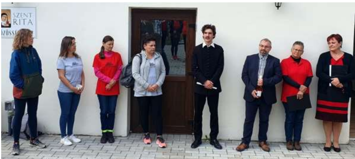
47. „Petőfi Sándor” elszavalja a Vadonban című, egyetlen Veszprémben írt versét