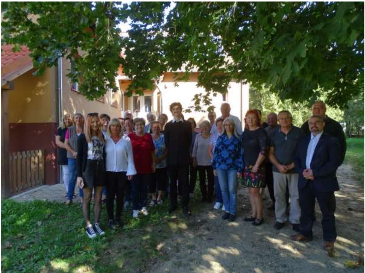
102. Mersevát: a zárandokok búcsúztatása előtti pillanat