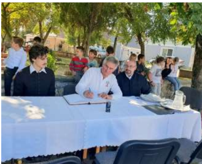
33. Az ösküiek üzenete bekerül a zárandokkönyvbe