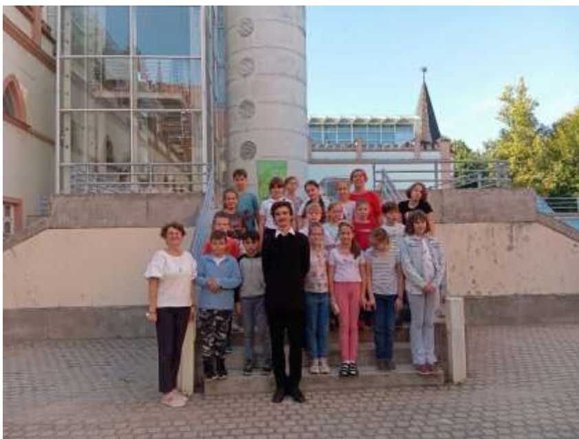
40. „Petőfi Sándor” és a veszprémi iskolások