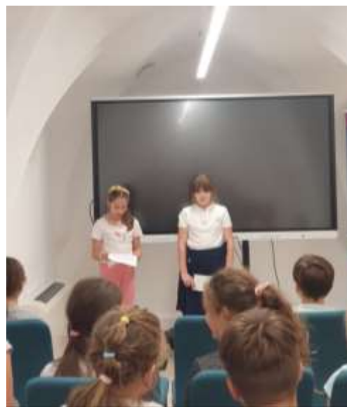
36. Kisiskolások Petőfi versekkel köszöntik "Petőfi Sándort"