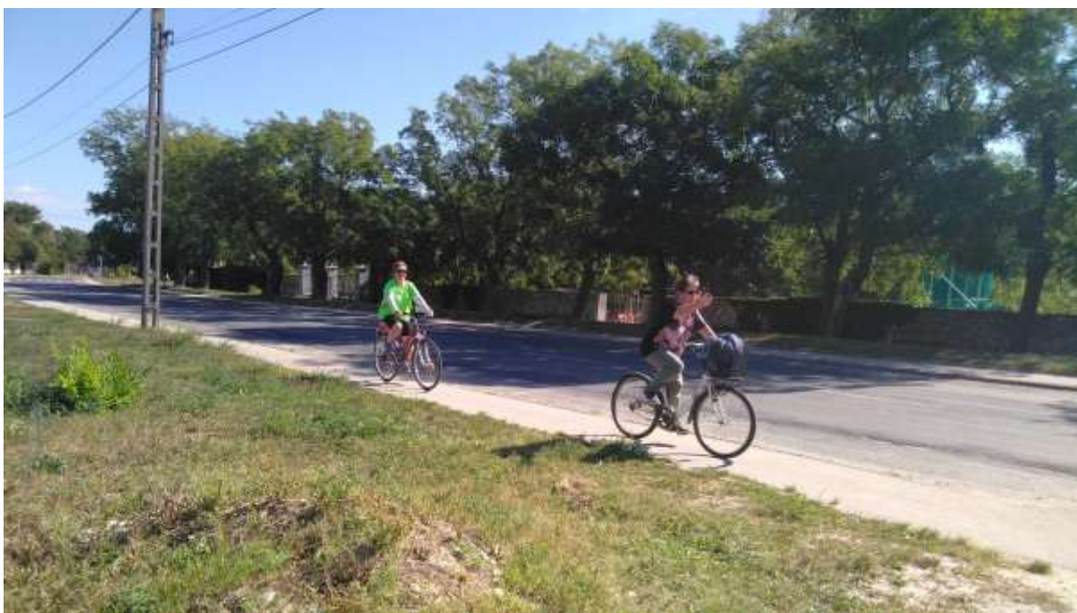
12. A fehérvári kerékpáros zárandoklatkülönítmény begördül Csórra