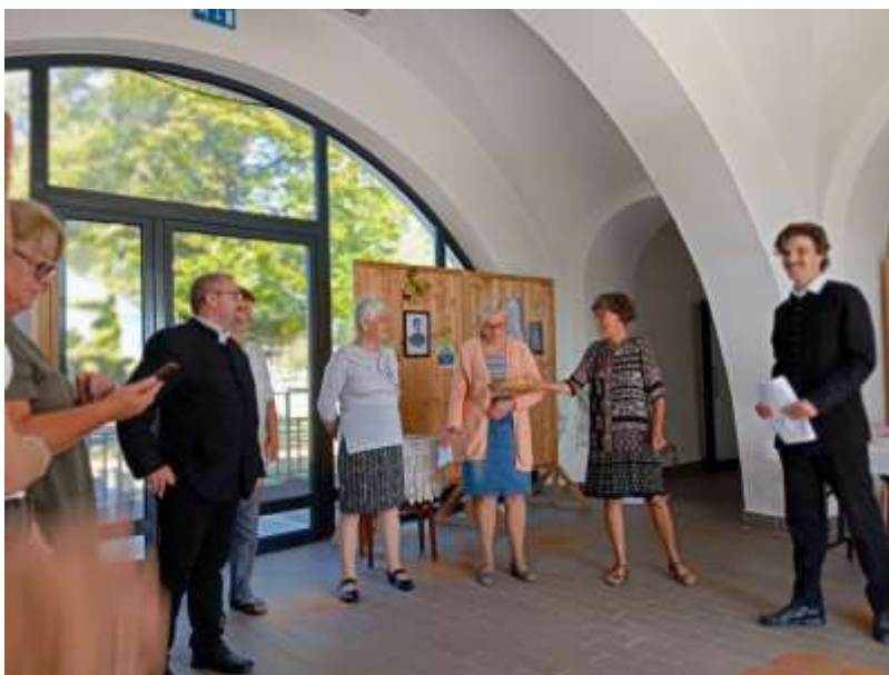
35. Hajmáskéri vendéglátóink tiszteletükre Petőfi-verseket szavalnak