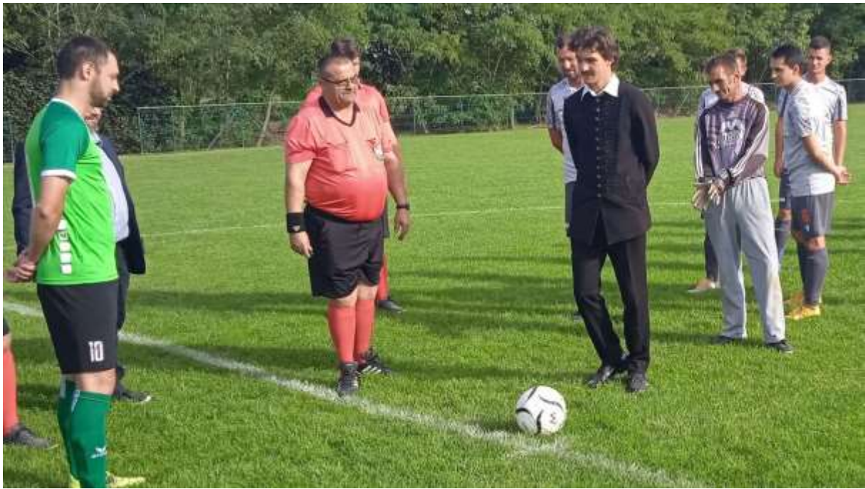
143. Petőfi Sándor elvégzi a szimbolikus kezdőrúgást (Ostffyasszonyfa megnyerte a mérkőzést!)