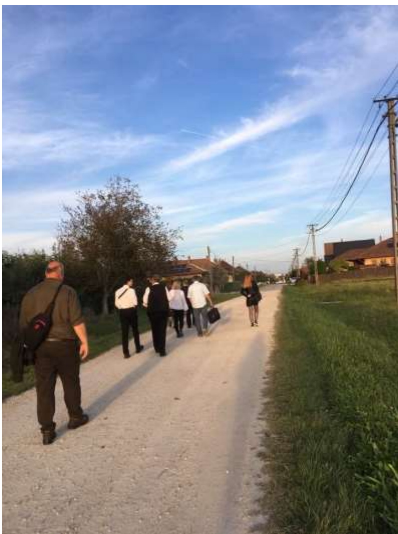
111. Zarándoklat a templomhoz a régi himnusz születésének helyszínére