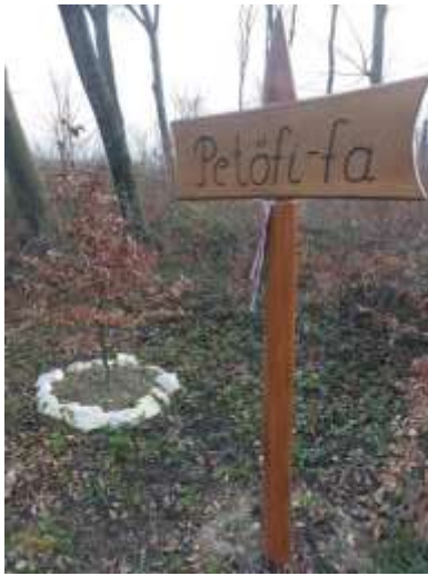
73. A Petőfi-fa 2024-ben megújult táblája