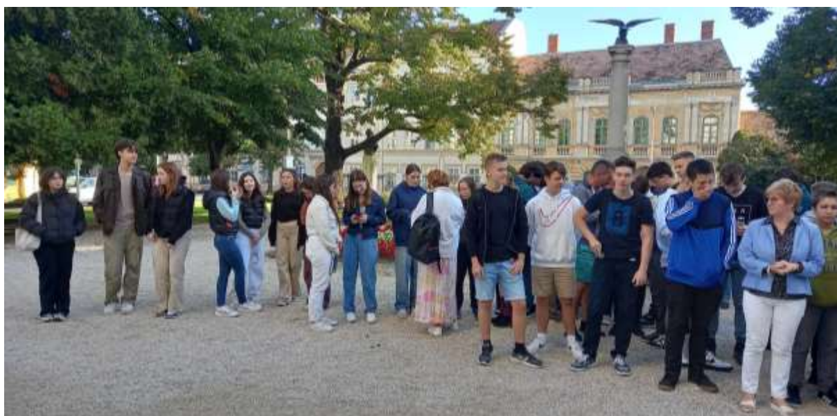
887/a A diáktársak egy része