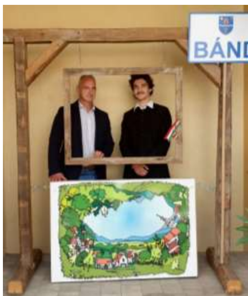
55. A polgármester és a „költő” közös fotográfián