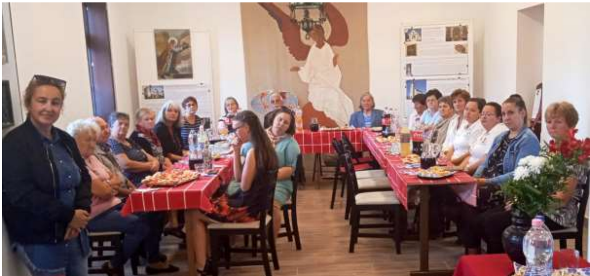
146. A közönség