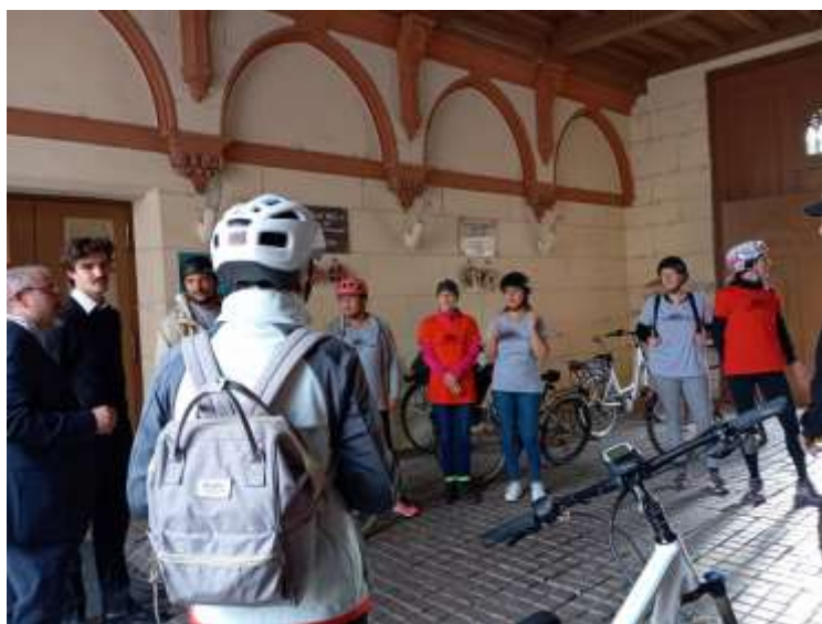
41. A zarándokok gyülekeznek a veszprémi kiindulóponton