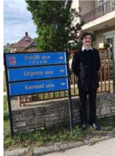
58. Petőfi a Petőfi utca táblájánál