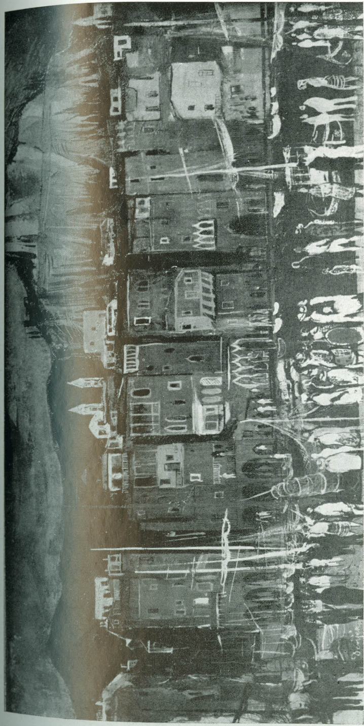
DEMJÉN ATTILA: Cefalu