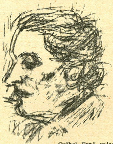
Czóbel Ernő rajza

kára, 1912-ben megjelent első verseskötete Ajándék címmel, amit két év múlva követett A távozó . Verseiben kezdettől fogva föltűnik a líraiság mellett az értelem szerepe is, sohasem hivalkodva, inkább