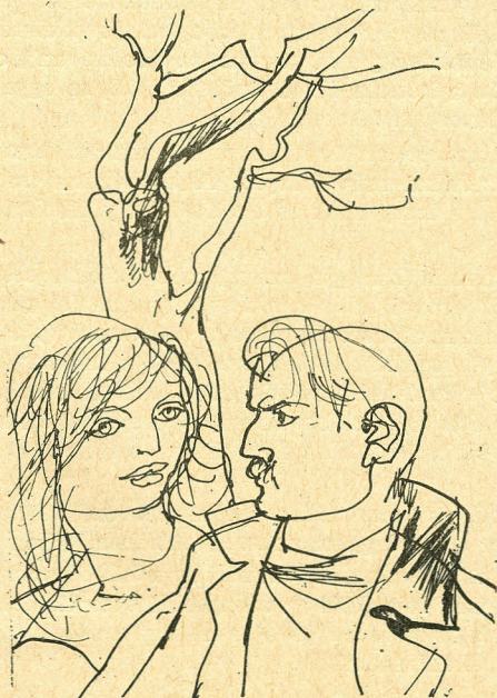
Nazim Hikmet: Romantika (kötésterv)

kezek, a hajfürtök, a néhány lapon keretdísznek igénybevett sokat kifejező fák, az építészetből kölcsönzött elemek rajzos és festői megoldása, a háttér finoman árnyalt texturája teljes művészi élményt adnak. Felmerülhet ugyan a kérdés, hogy a téma hangulatához nem illt volna-e jobban, s a könyv művészi (formai, tipográfiai) egységét nem fokozta volna-e, ha a világos barna festékezés helyett feketét választott volna a kiadó? Aligha. Sőt, ezzel a megoldással, amellyel e könyv grafikai készült, mondhatni két szint nyert egyszerre: a háttér tónusának világos barna árnyalatai mellett a feketébe mélyülő vonalak — hidegtű technikával — összehasonlíthatatlan finomságokat eredményeztek.