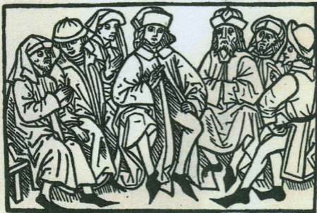
Иллюстрация. Гравюра на дереве. До 1478 г.