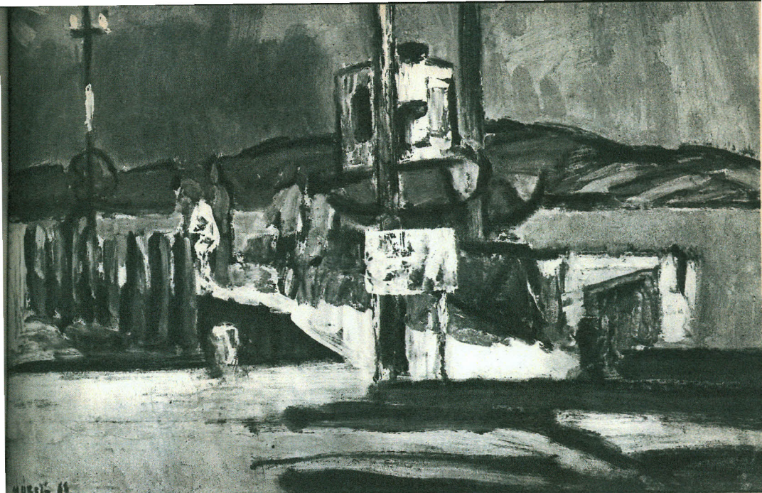
Mórítz Sándor: Róvikikötő – Port du bac – Пирвал и попры

A munka, mint tartalom, nem tolszikzik előtérbe a festői mondani-való kárára. Mórítz nem is a munka szépségét ábrázolja, mert számára nincs külön a munka, a gép, az ember, szép munka és ronda munka, hanem maga az élet áll előtte a maga egységében. S mivel Mórítz a kompozíció festői lehetőségeit ragadja meg, ezért a képszerűség adja meg a valóság művészi karakterét. Eppen ebből következik, hogy nem elbeszélő ez a festészet, az irodalmi mondani-való helyett a festői uralkodik rajta anélkül, hogy ez elmosná a valóság kontúrjait. Lirai alkotát, amelyről még lesz szó, üzemi képein sem tagadta meg.