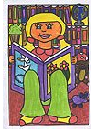
Már az Interneten is vár Téged a gyermekkönyvtár

A pályaművek beadási határideje: 2010. március 15.