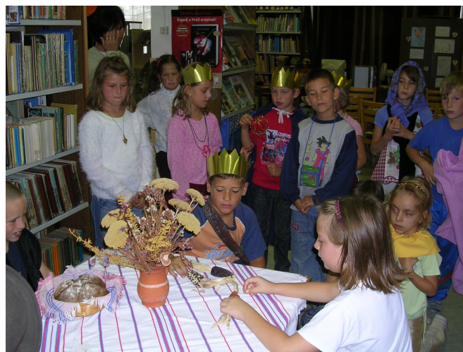
Inotai kisiskolások játszanak a nagy mesemondó, Benedek Elek évfordulójára szervezett programon

Ezen a napon Ajka, Balatonfüred, Devecser, Pápa, Sümeg, Tapolca, Várpalota, Veszprém gyermekkönyvtárosaival közös programot szerveztünk. Minden helyszínen Az elrabolt királykisasszony című mese állt a középpontban, melyet egységesen a japán Kamishibai technikájával mutattunk be. Könyvtárunkba a Várkerti Általános Iskola és Szakiskola Inota Tagiskolája 2. osztályos tanulóit hívtuk meg a mesedéllelőtre.