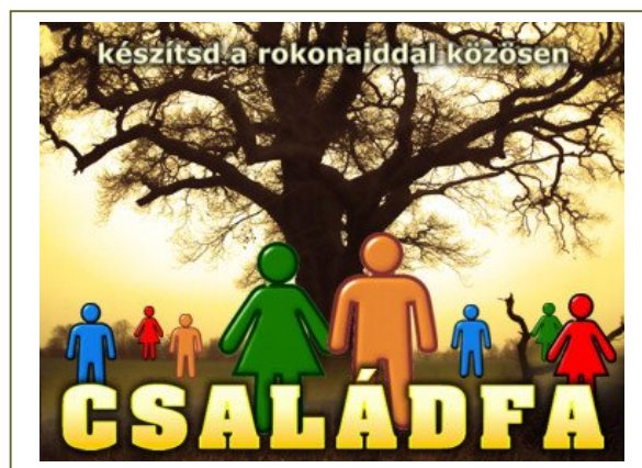
Az Ittvoltam.hu Családfa-projektjének logója

A folytatást lásd Családfa-projekt címmel az 5. oldalon