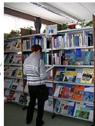
Európai uniós különgyűjtemény a város könyvtárában

A lista azt mutatja, hogy a leggyakrabban kölcsönzött könyvek közül melyiket hányszor kölcsönözték ki a hónapban.