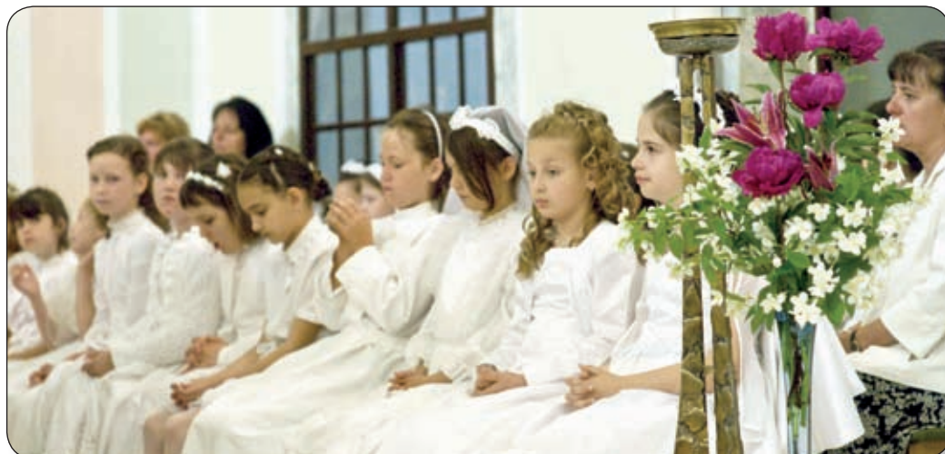
VÁROSUNK KATOLIKUS HITOKTATÁSBAN RÉSZESÜLŐ GYERMEKEI ELSŐ SZENTÁLDÓZÁSUKKOR

Minden év tavaszán, pünkösd ünnepe közeledtével részesedhetnek a bérmlás szentségében városunk ifjai. Idén május 8-a volt az a