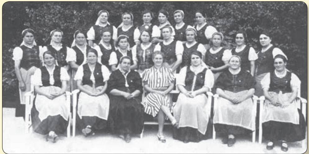
BÁNYÁSZASSZONYOK MISSZIÓS EGYESÜLETÉNEK TAGJAI 1937-BEN

Évente két-három alkalommal műsoros teadélutánt rendeztek. A műsorhoz más egyesületi, olvasóköri tagokat is hív-