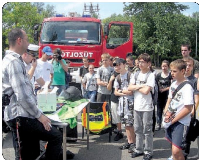
A GYEREKEK MEGISMERHETTÉK A TŰZOLTÓI HÍVATÁST

A rendezvény célja a különböző szervezetek munkaköreinek ismeretése, majd a szervezett iskolai csoportoknak vetélkedőket rendeztek, ahol a diákok a program témájának megfelelően összemérhették tudásukat, végül a győztesek számítástechnikai eszközöket kaptak nyeresiményként.