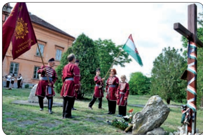
AZ ATILLA HARCOSAI VÁRPALOTAI BARANTÁSOK TISZTELEGTEK A TRIANONI EMLÉKMŰ ELŐTT

1920. június 4., a magyarság egyik legnagyobb tragédiája hiányzott a könyvekből hosszú évtizedekig. Sok generáció még mára sincs tisztában azzal, hogy mi is történt valójában, amikor kiszakították az országból a szívet és hagyták egyedül verdesve dobogni. Bőjte Csaba évekkal ezelőtt a várpalotai gyászünnepen azt mondta: nem kell gyászolni, eleget sírtunk, nézzünk előre, álljunk fel és tekintsünk a jövőbe. Igen, ők eleget sírtak, mi nem. Nekünk még el kell siratnunk Triant, hogy aztán letöröljük a könyveket, felálljunk, és előre lépünk.