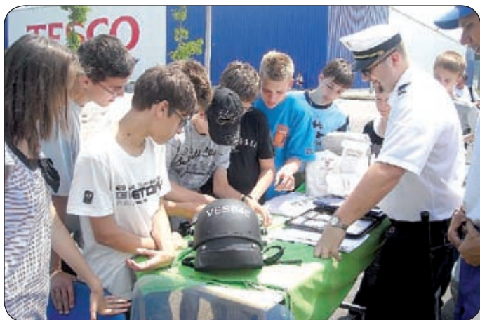
RENŐRSÉGI FELADATOK KÖZÖTT SZEREPELT NYOMFELISMERÉS, PUZZLE, 3D-S NYOMRŐGZÍTÉS, KÖZLEKEDÉSI ÉS DROGOS TOTÓ

A vetélkedők két fordulóbán zajlottak. Első fordulóbán a Bartos Sándor Iskola, Nepomuki Katolikus Általános Iskola, Vár-