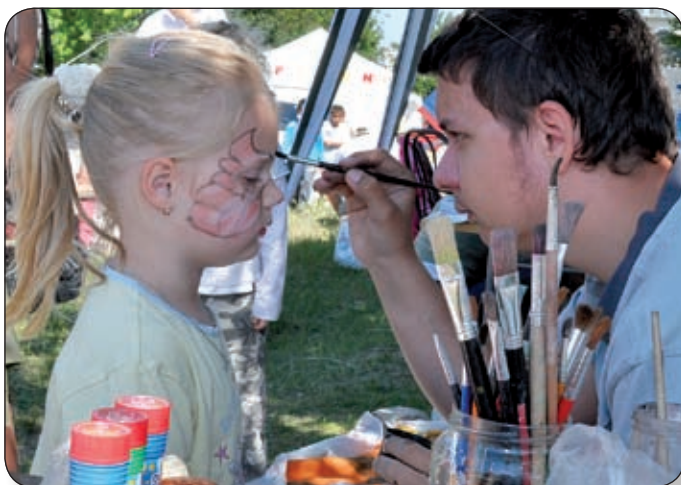
A GYERMEKEKET SOKFÉLE PROGRAM VÁRTA, ÍGY TÖBBEK KÖZÖTT ARCFESTÉS, ASZFALTRAJZOLÁS, SPORTOLÁS, GOKARTOZÁS ÉS KÉZMŰVES-FOGLALKOZÁSOK

Az újság a www.palotai-hirnok.hu , a www.varpalota.hu és a www.varpalotai.hu oldalon.