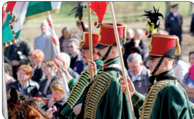
A MEGEMLEKÉZÉS FÉNYÉT HUSZÁROK DÍSZELGÉSE IS EMELTE