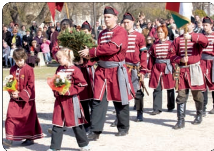
KOSZORÚT HELYEZTEK EL AZ ATILLA HARCOSAI VÁRPALOTAI BARANTÁSKÖZSÉG TAGJAI