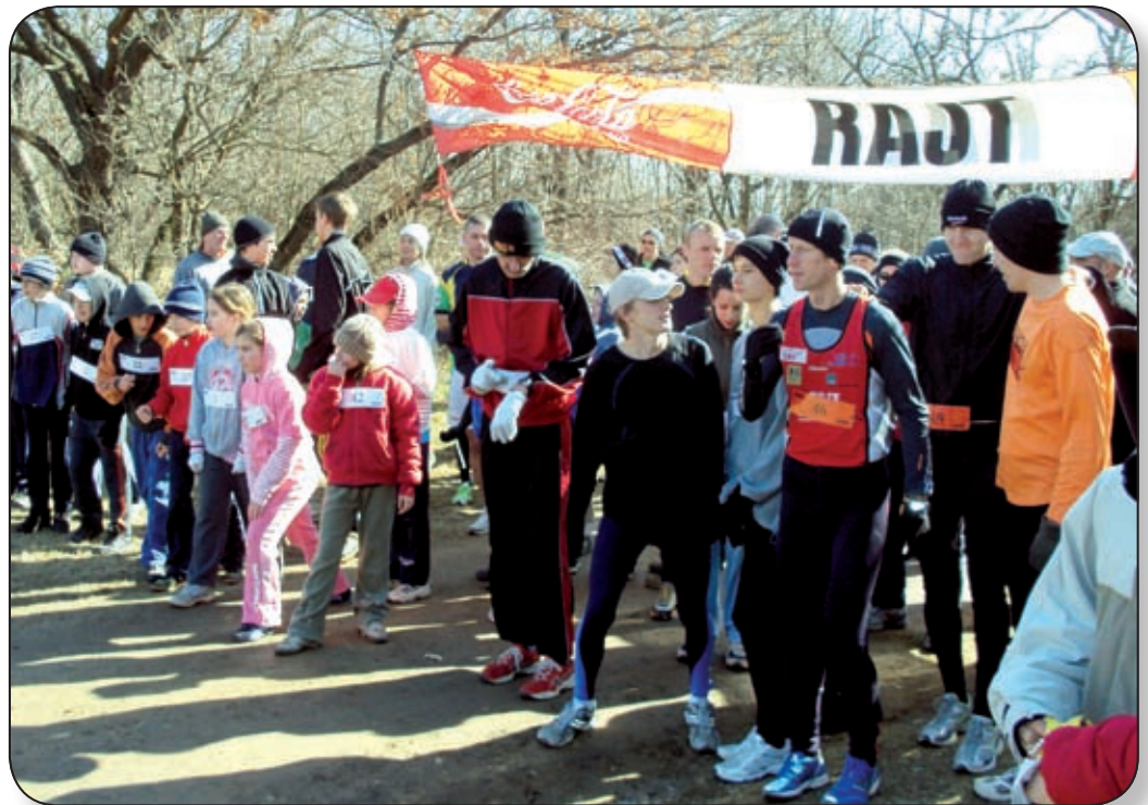
HÁROM TÁVON TELJESÍTHETEK A RAJTHOZ ÁLLÓ VERSENYZŐK A JÓ HANGULATÚ MEGMÉRÉTTETÉSEN

A dobogósok éremet, kupát és tárgyjutalmat vehettek át, és természetesen a nőnapról sem feledkeztek meg a verseny szervezői. Virágot kapott a legidősebb – 64 esztendő – és a legfiatalabb versenyző hölgy, aki mindössze két éves volt. BALÁZS KITTI