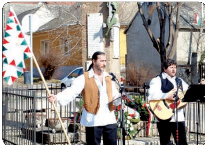
ÍNÓTÁN IS SZÍNVONALAS, ZENÉS MŰSORRAL TISZTELEGTEK A FORRADALOM ELŐTT