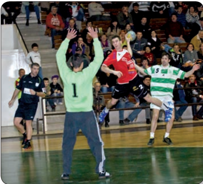
PALOTAI TÁMADÁS A GYŐRI ETO ELLENI TALÁLKOZÓN – AZ EREDMÉNYES TÁMADÓJÁTÉKRA AZ ALBA REGIÁLVAL SZEMBEN IS NAGY SZÜKSÉG LESZ