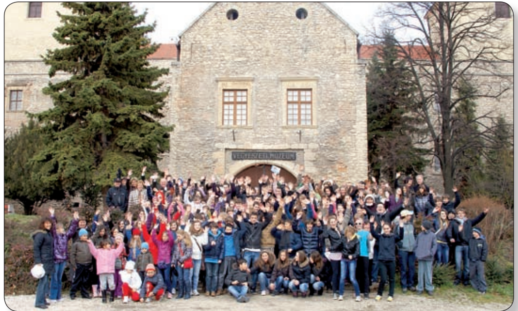
A DALOS AJKÚ FIATALOK EGY KÖZÖS FOTÓZÁSRA IS ÖSSZEÁLLTAK, EZZEL IS EMLÉKEZETESSÉ TÉVE A FESZTIVÁLT

Második alkalommal került ismét Várpalotán megrendezésre március 19-én a különleges esemény, a TEMA nemzetközi gyermekkórus-fesztivál. Az előadott darabokon keresztül megcsillant Ausztria, Szlovénia, Lengyelország, Olaszország, Románia és Magyarország. Számtalan népdal, kórusmű csendült fel a gyermekhangokon, sok esetben hangszeres kísérettel. Látványos volt többek között a román népviseletben színpadra lépő csapat, az olasz himnusz felhangzása, de a várpalotai dalosok is, akik egyesített kórusokkal, hatalmas számban töltötték be a színpadot. A karok fellépése