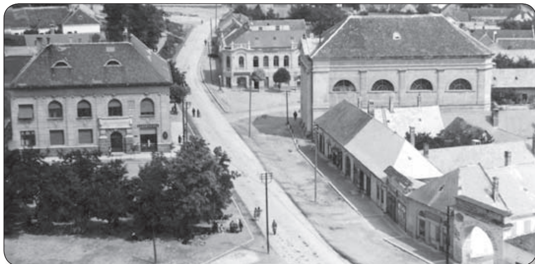
EGY RÉGI VÁROSKÉP