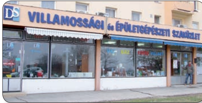
GARANTÁLT AZ UDVARIAS KISZOLGÁLÁS, A VERSENYKÉPES ÁR ÉS A SZÉLES ÁRUVÁLASZTÉK

– A bt. 1996-ban alakult. Fűtés- és vízvezeték-szereléssel indultunk, ami a mai napig a cég főprofilja. 2005 nyarán nyitottuk meg üzletünket, melyben az első néhány évben csak villamossági termékeket árultunk, ám tavaly óta épületgépészeti cikkek is vásárolhatnak nálunk. A közelmúltban új lehetőség nyílt a terjeszkedésre, így bővebb árukészlettel működhet mostantól üzletünk. Célunk, hogy nálunk minden olyan terméket megtaláljanak vevőink, ami a villamossági és épületgépészeti profil