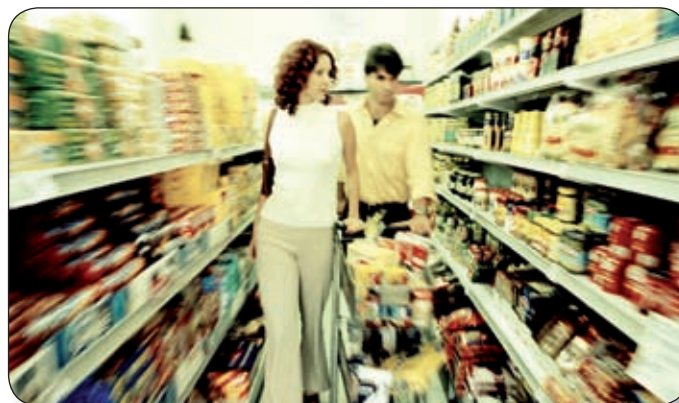
KERESSÜK A BOLTOKBAN, A VÁSÁRLÁSNÁL A KÖRNYEZETKÍMÉLŐ CSOMAGOLÁSÚ TERMÉKEKET!

Becslések szerint egy négyfős háztartás átlagosan évente 1800 kg hulladékot termel. És ezt mind meg is veszik egyszer! Gondoljuk végig, hogy mit vásárolunk. A legösszegezőbb módszer a bevásárlólista készítése, a hozzá való ragaszkodással pedig szép összegeket takaríthatunk meg. A környezettudatosság már a vásárlásnál kezdődik, például azzal, hogy vásárláshoz kosarat, gurulós bevásárlókocsit vagy vászontás-