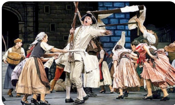
JELENET A TENKES KAPITÁNYA CÍMŰ ZENÉS-TÁNCOS ELŐADÁSBÓL

A téma a Rákóczi-szabadságharc idején, Siklós környékén folyó kuruc-labanc küzdelmeket idézi. A főszereplő Eke Máté, Béri Balog Ádám kuruc brigádéros katonája ugyan költött személy, de számos jobbágykatonából lett kuruc tiszt történelmi alakját ötvözi egybe. A történet meszeszerűen, sok humorral mutatja be azokat a kuruc hősokeket, akik ravaszsággal, magyaros virtussal végül is legyőzik a bugyuta labancokat.