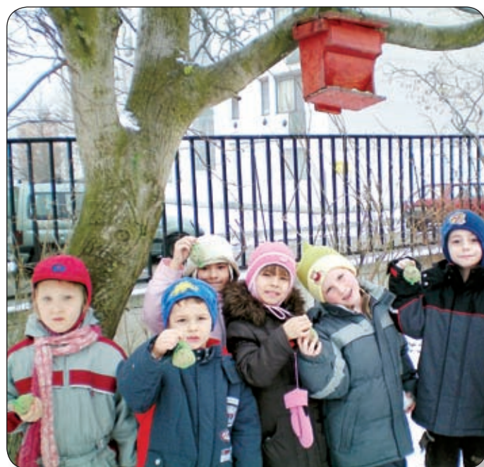
A GYERMEKEK SZÁMÁRA IZGALMAS SZÓRAKOZÁS ÉS JÁTÉKOS TANULÁS IS A MADÁRBARÁTSÁG

Az eredmény nem maradt el, a visszaküldött jelentő lap és a tevékenységet bizonyító fotók meghozták a gyümölcsöt. Év végén elnyerte az intézmény a Madárbarát óvoda címet, amely azóta az ovi falán hirdeti, hogy az ide járó gyermekek jó ismerősei már a madárvilágnak.