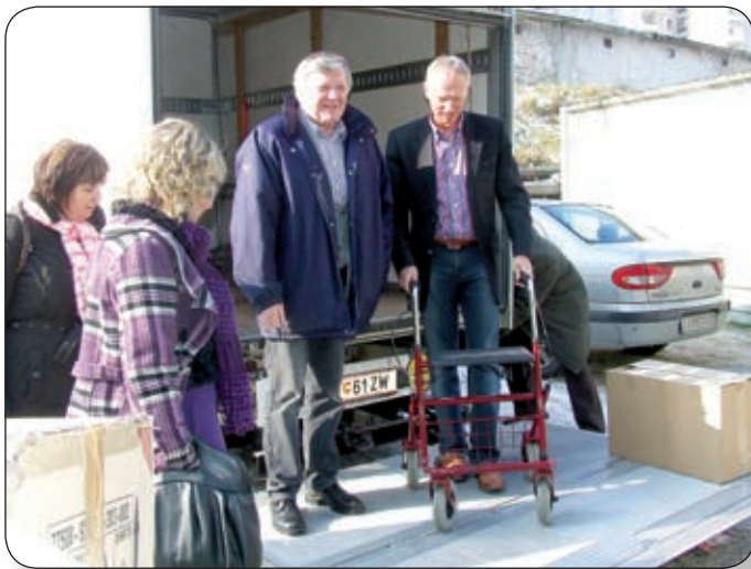
A WOLFSBERGI DELEGÁCIÓ AZ ÁPOLÓOTTHONBA IS ADOMÁNYOKKAL MEGRAKVA ÉRKEZETT