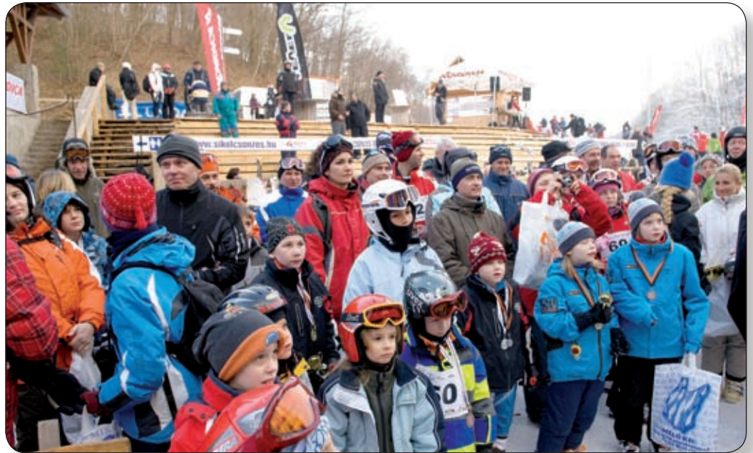
Kicsik és nagyok egyformán jól érezték magukat e remek napon

Nagy volt az izgalom, valamennyien arra törekedtek, hogy minden erőt összeszedve, a lehető leghamarabb, minél kisebb ívekben, sportszerűen tegyék meg a kitűzött távolságot. A