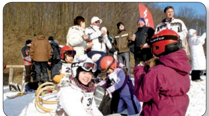
A verseny után előkerült a megérdemelt uzsonna is