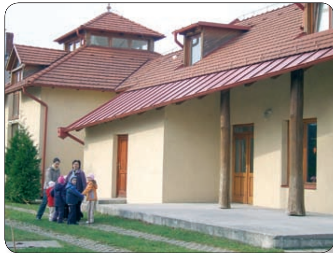
HÚSZ ÉVE NYITOTTA MEG KAPUJÁT AZ EVANGÉLIKUS ÓVODA

A városi tanács 1970-ben vette át a templom melletti paplakot, akkor az 1973-ban felépült házba (a mai óvoda épülete) költözött a lelkészi lakás és iroda. A paplakban ezt követően tanácsi óvoda működött, amelyet 1990-ben vehetett át az evangélikus egyház, megalapítva ezzel az ország első evangélikus óvodáját. 1993-ban vált lehetőség arra, hogy felköltözzön az intézmény a mostani épületbe, amely addig lelkészi lakás és iroda volt. Az eredetileg is lelkészlakásként szolgáló épület pedig újra paplakká vált. 2001-ben történt egy nagyobb bővítés az óvoda épületén, ekkor vált az óvoda igéjévé az „Isten adja a növekedést”, az 1Kor.3.7b alapján.