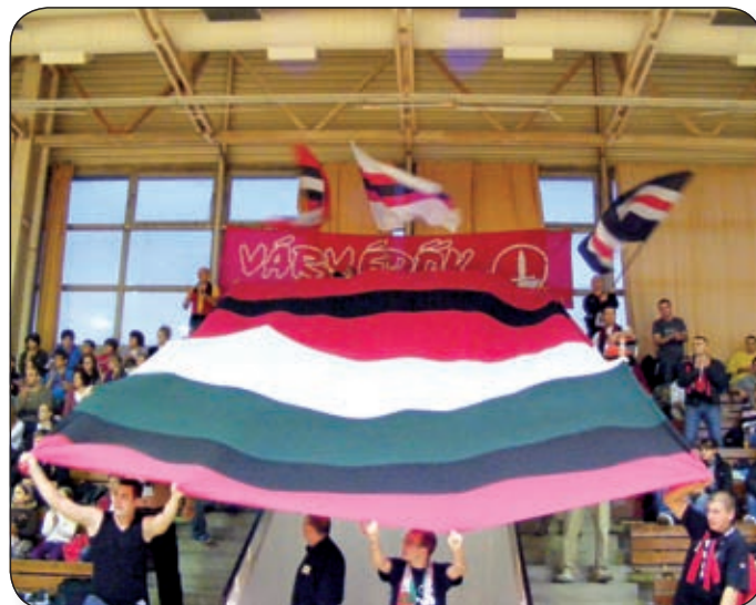
A VÁRPALOTAI SZURKOLÓKON EZÚTTAL SEM MÚLOTT