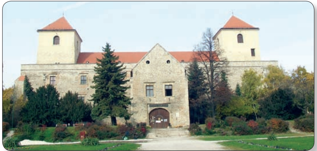
A VÁRPÁLYÁZAT MEGVALÓSÍTÁSA SORÁN PROBLÉMÁK KERÜLTEK FELSZÍNRE