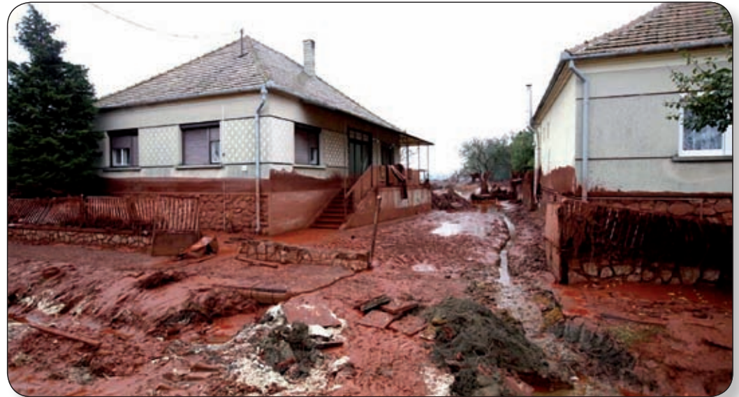
TÖBB SZERVEZET VÁRPALOTAI EGYSÉGE VETT ÉS VESZ RÉSZT A MENTÉSBEN ÉS A KÁRELHÁRÍTÁSBAN

A gátszakadás következtében közel egymillió tonna maró hatású vörösiszap ömlött ki, mely több mint ezer hektáryi területen végzett súlyos pusztítást. Szerencsére nagyon sok segítő kéz akadt az október 4-i katasztrófa áldozatainak megsegítésére. Különböző szervek, szervezetek képviselői és önkéntesek százai vesznek részt nap mint nap a munkálatok során. Városunkból a rendőrség, a honvédség, a polgári védelmi kirendeltség és a mentőszolgálat állománya is segédkezett és segédkezik a helyszínén.