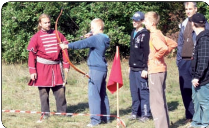
A CSAPATOK ÍJÁSZATBAN IS ÖSSZEMÉRHETTÉK TUDÁSUKAT

Eredmény: 1. MH BHK diákcsoportja, 2. Csupaszív Nagycsaládos Egyesület csapata, 3. Bán Aladár Általános Iskola. Zászló- és indulóverseny: 1. Rákóczi-telepi Tagiskola, 2. Vásárhelyi András Tagiskola, 3. MH BHK diákcsoportja. A totó győztese: Inotai Tagiskola.