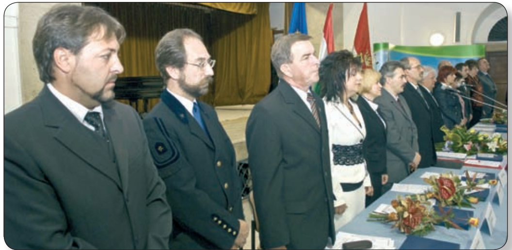
A KÉPVISELŐ-TESTÜLET FRISSEN MEGVÁLASZTOTT TAGJAI ÜNNEPÉLYES FOGADALMAT TETTEK

Az ülés során Talabér Márta ünnepi programbeszédet tartott, amelyben köszönetet mondott a várpalotaiaknak a támogatásért. Hangsúlyozta, hogy a tisztaság, az egyéni érdekektől való mentesség, a jogszabályoknak megfelelő dön-