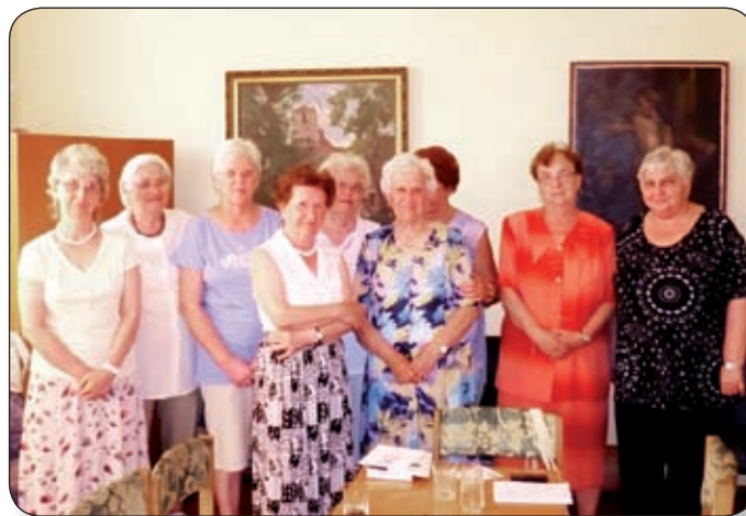
AZ EGYESÜLET CÉLJA A NYUGDÍJASOK ÖSSZEFOGÁSA

A több mint huszonegy éve működő egyesület célja a nyugdíjasok összefogása, szabadidejük eltöltése szórakozással, a közösségteremtés és rendszeres társasági élet biztosítása. Jó ideje már heti rendszerességgel csütörtökönként egy kellemes beszélgetős délutánt töltenek el a Jó Szerencsét Művelődési Központban és közösségi programokat szerveznek. Havonta egyszer különböző témákban előadókát hívnak például kultúra, egészségmegőrzés területéről, névnapot ünnepelnek vagy épp kirándulásokat szerveznek a közelben, amire költségekértükből telik. Jártak többek között