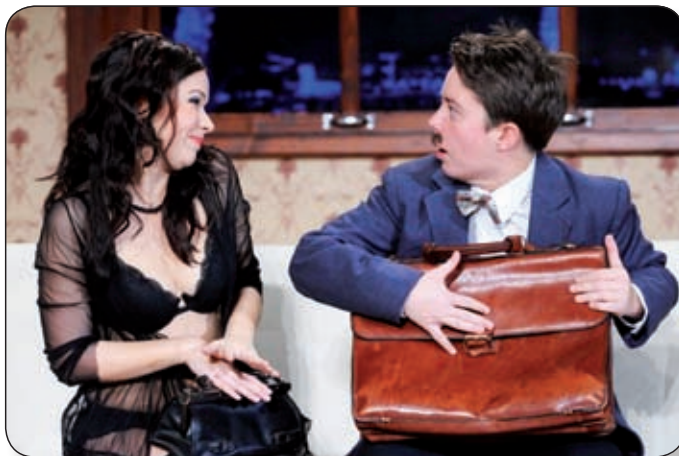
JELENET A MINISZTER FÉLRELÉP CÍMŰ ELŐADÁSBÓL

Öt előadásból álló bérletet indít Inotán a Retróban ősztől a Pannon Várszínház. Közönségük három zenés produkciót, egy vígjátékot és egy bűnügyi társasjátékot láthat majd. Az évad Ray Cooney Miniszter félrelép című fergeteges vígjátékával indul, melyet a mozivászaronról már sokan ismerhetnek. A darab 1991-ben, Angliában megkapta az év legjobb vígjátéka elismerést. Richard Wiley a kormány egyik ambiciózus minisztere gáláns kalandra készül. Azt tervezi, hogy Jane Worthingtonnal, az ellen-