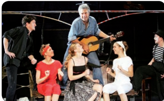
BOLDOG IDŐ – MUSICAL ZORÁN DALAIBÓL

A huszonnyolc dalból álló két részes darab története egy vándorról szól, aki megérkezik egy kocsmába, valamikor a huszadik század végén. A sorra felcsendülő dalok segítségével visszaemlékezik családjára, barátai, szerelmei történetére, egészen a második világháborúig visszanyúlóan. A dalok között nincs is próza, végig zene szól, a dalszövegek mellett pedig a látvány, a táncok