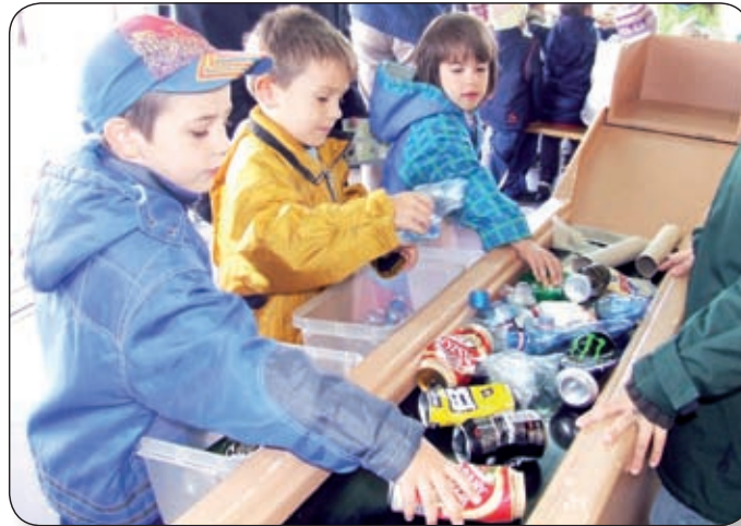
A PROGRAM KÖRNYEZETTUDATOS GYERMEKEKET NEVEL JÁTÉKOS ESZKÖZÖKKEL

Az Öko-Pannon Nonprofit Kft. mozgó kiállítása 2007 óta minden szeptemberben útra kel, hogy élményszerű formában ismertesse meg a magyar diákokat a szelektív gyűjtéssel, a hulladékok újrahasznosításával. Az újrahasznosítási hónap rendezvénykamionja szeptember és október folyamán 19 városba látogat el. Az interaktív kiállítás Várpalotán a Thuri György téren tele-