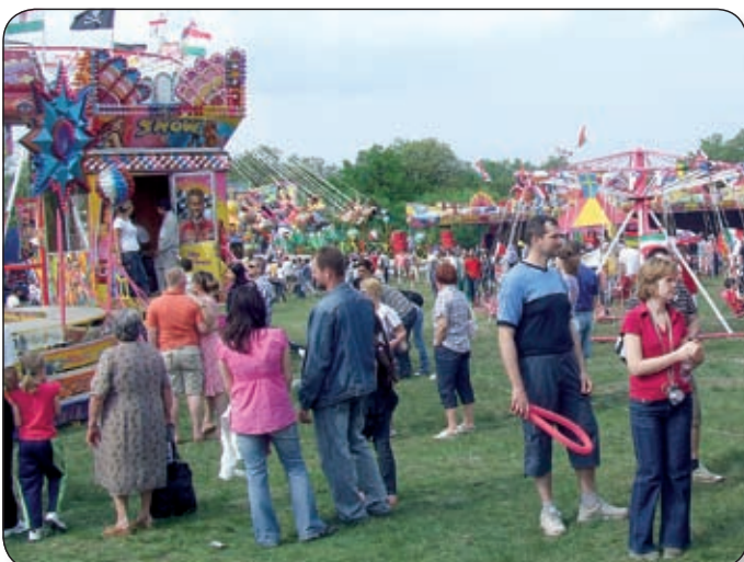
A JÓ IDŐ SOK LÁTOGATÓT CSÁBÍTOTT KI A NYOLCAS ÚT MELLETTI PARKERDŐBE