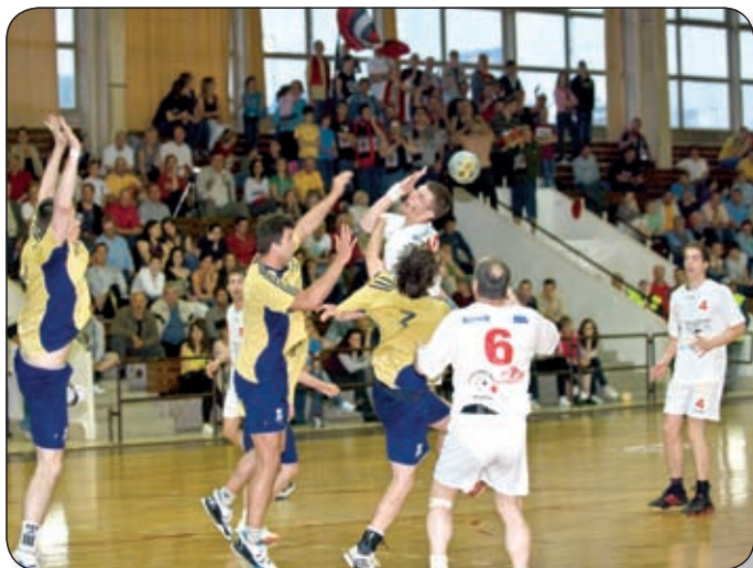
A PALOTAI FIÚK MEGÉRDÉMELT GYŐZELMET ARATTAK A TAVALY MEG ELSŐ OSZTÁLYÚ ETO ELLEN