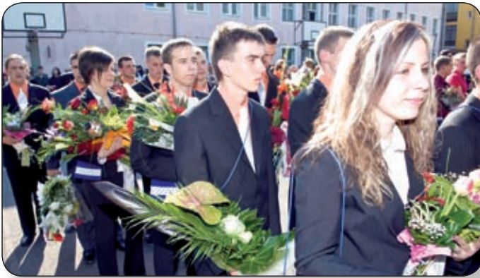
VÁROSUNK KÖZÉPISKOLÁIBAN ÁPRILIS 30-ÁN BALLAGTAK EL A DIÁKOK. A FALLER SZAKKÉPZŐ ISKOLÁBAN NYOLC, A THURI GIMNÁZIUMBAN HÁROM VÉGZŐS OSZTÁLY BÚCSÚZOTT AZ ALMA MATERTŐL. KÉPÜNK A FALLER BALLAGÁSI ÜNNEPÉLYÉN KÉSZÜLT.