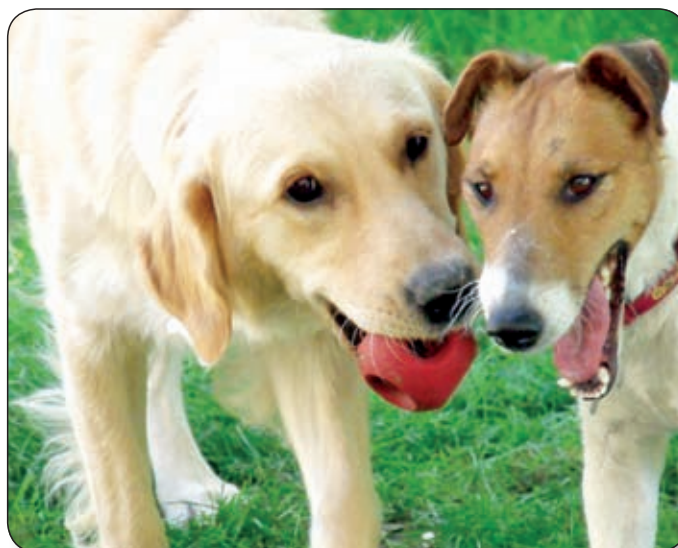
MANGÓ ÉS ZIZI MEGTALÁLTÁK GONDOSKODÓ GAZDÁJUKAT, AKINÉL REMEKÜL ÉRZIK MAGUKAT

akik kínozzák vagy rossz körülmények közt tartják állataikat. A túlszaporodás miatt a másik fő tevékenységünk a kutyák és macskák ivartalanítása, mivel ez az egyetlen módszer, amivel meg tudjuk akadályozni, hogy még több állat kóboroljon az utcákon.