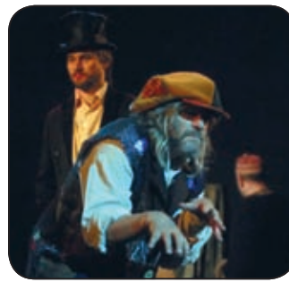
HOBO A VADÁSZAT EGYIK JELENETÉBEN

Dramaturgiája szerint nem klaszszikus értelemben vett színházi előadást ígérnek a közönségnek, inkább