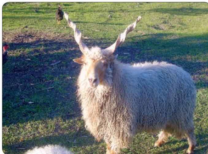
A RACKA JUH EGYKOR A PÁSZTOROK JELLEGZETES RUHÁZATÁNAK ALAPANYAGÁT SZOLGÁLTATTA

Ez a különleges fajtánk, amelyhez hasonlót sehol a világon nem tenyésztenek, elsősorban Debrecen környékén, a Hortobágyon és a Kiskunságban terjedt el. Nehéz elképzelni, de a racka is – mint minden háziállat – a muflontól származik. Mindig a magyarságot részét képezte, emiatt ma is több kistenyésztő magángazda tart néhány példányt egyéb fajtájú juhai között. Egykor a pásztorok jellegzetes ruházatkódásának (suba, guba, cifra szűr) nélkülözhetetlen alapanyagait szolgáltatta. Természetesen húsát, tejét mindenkor szívesen fogyasztották. Az időjárás