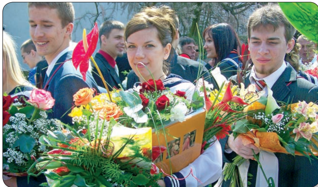
BALLAGÓ THURIS DIÁKOK. EGY KORSZAK LEZÁRULT A FIATALOK ÉLETÉBEN

Szombaton délelőtt a Faller Jenő Szakképző Iskola is búcsút vett csaknem 165 végzős szak- középiskolai és szakiskolai diák-