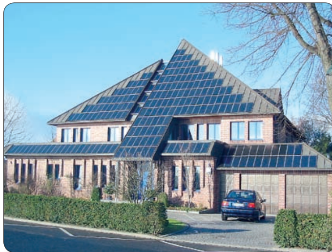
AZ EGYIK LEGELTERJEDTEBB ÚJ ENERGIATAKARÉKOS FŰTÉSI TECHNOLÓGIA A NAPKOLLEKTOR

Miről is van szó? A hazai energiaárakban bekövetkező drámai változás miatt egyre többen fektetnek nagy súlyt a különböző alternatív fűtési módok bevezetésére. De ha ezek közül csupán a napkollektorok hatékonyságát vizsgáljuk is, amelyet például egy újgenerációs kondenzációs kazánnal szerelünk, már így is jelentős megtakarítást érhetünk el. A gázzsámla akár 40%-kal csökkenthető. Természetesen ehhez a fűtési rendszert is hozzá kell igazítani, de ha csak a kazánt cseréljük le, nos így is 20-