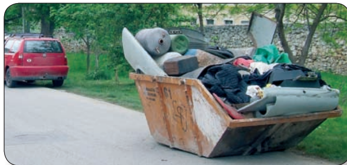
SOKAN ÉLNEK AZ AKCIÓ ADTA LEHETŐSÉGGEL, S SZABADULNAK MEG LOMJAIKTÓL

A város évek óta megszervezi az elektronikai lomtalanítást a la-