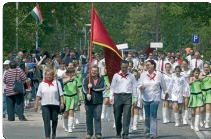
A RÉSZTVEVŐK KIVÁLÓAN SZÓRAKOZTAK A MAJÁLISON