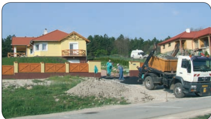
VÉGSŐ SIMÍTÁSOK AZ ÚJONNAN ÉPÜLT HÁZ KÖRÜL A LONCSOSBAN

gek, amelyek megkeresik és meg is találják a család, a személy számára legjobb feltételeket biztosító hitelkonstrukciókat, a legjobb banki ajánlatot. Érdemes tehát felkeresni ezeket. Nincs idő azonban hosszú latolgatásra: akár az új otthon bekerülési költségének egynegyedét is elveszithetjük az által, ha nem fogunk bele időben az építkezésbe, lakásvásárlásba, a hitelkérelmek benyújtásába.