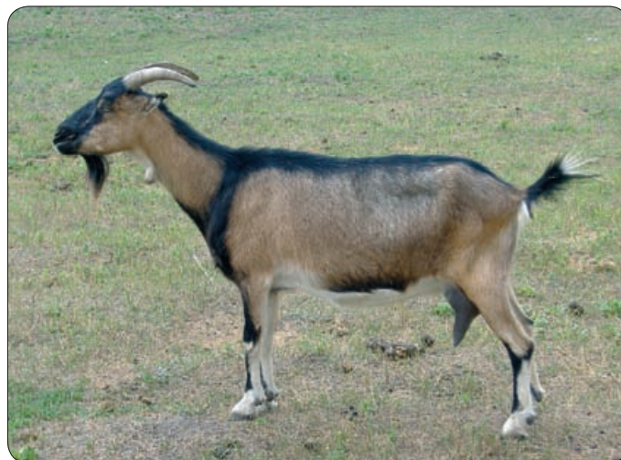
A MAGYAR PARLAGI KECSKE. TEJÉNEK TÁPÉRTÉKE AZ ANYATEJÉVEL VETEKSIK

Magyarország kecskeállománya meglehetősen vegyes. Általában egyszínűek: fehérek, vörösek, feketék. Hazánkban a kecskét a szégyen ember tehenének nevezték,