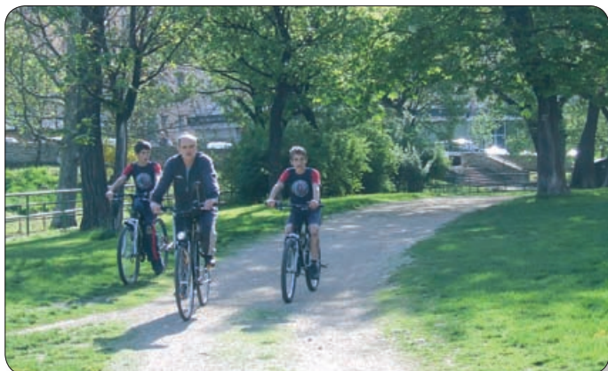
KERÉKPÁROSOK A VÁRNÁL. A SPORTESEMÉNY AZ EGÉSZSÉGES ÉLETMÓDRA IS NEVELT

Nagy kerékpáros sportesemény helyszíne volt vasárnap a Thurivár mögötti füves terület. A város önkormányzata a Gyermek Sportjáért Egyesülettel és a Bakonyi Kerékpáros Egyesülettel közösen szervezte meg ezen eseményt. Németh Árpád polgármester nyitotta meg a rendezvényt, majd ő maga is nyeregbe szállt, hogy ezzel is népszerűsítse a kerékpársportot, s az egészséges