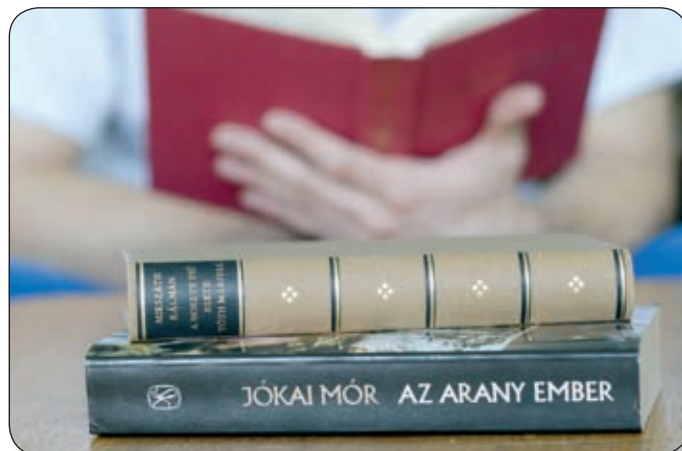
AZ ÖNKORMÁNYZATA PÁLYÁZATOT NYÚJT BE AZ OKTATÁSI MINISZTERIUM PÁLYÁZATÁRA

A Honvédelmi Minisztérium miniszteri biztosa pályázatot hir-