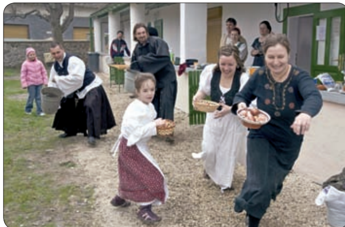
A KÉZMŰVESHÁZBAN FELELEVENÍTETTÉK A RÉGI NÉPSZOKÁSOKAT

A rendezvény témája a március hónap szokásai, jeles napjai köré