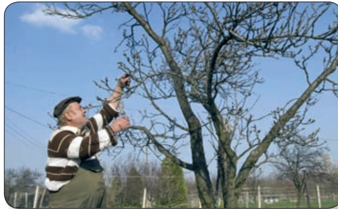
ÉLET A KISKERTBEN. A TAVASZI GONDOS, SZAKSZERŰ MUNKÁVAL MEGALAPOZHATJUK AZ ÉVI BŐSÉGES TERMÉST

Mielőtt kimentünk volna a kiskertekbe, megnéztük a városban, milyen lehetőségeik vannak a gazdáknak beszerezni a szükséges vetőmagokat, gépeket, felszereléseket. Utunk először a piaci gazdaboltba vezetett, ahol nem csak vetőmagokból, permetszerekből volt nagy választék, de ingyenes növényvédelmi szaktanácsadást is kaphattunk a növényvédők szerek használatához. A Szabó kerttechnika üzletében sok hasznos gép és szerszám közül választhattuk ki az éppen megfelelőt. A Liget-sziget-