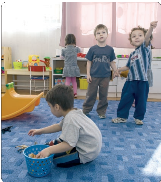
ÉLET A BÖLCSŐDÉBEN – NEM SOKÁRA MEGÚJULHATNAK AZ INTÉZMÉNYEK JÁTSZÓTERE