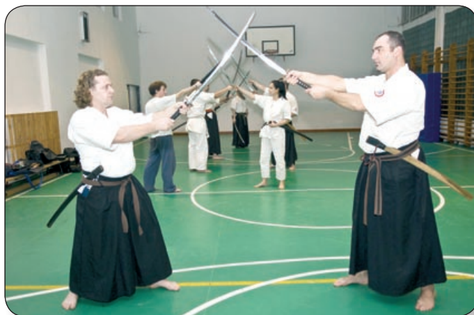
ÖNVÉDELMET, ÖNFEGYELMET ÉS ÖSSZPONTOSÍTÁST TANULHAT MINDENKI

– Három fő részre osztjuk fel, az önvédelmi technikára, kondicionálásra; a kardvágó technika csiszolására; valamint a küzdelemre, a tanult gyakorlati megvalósítására.