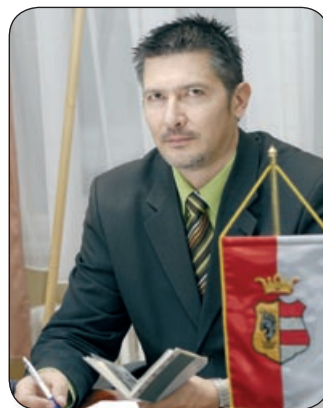
NÉMETH ÁRPÁD POLGÁRMESTER

le, a Loncsosi út felújítása, illetve a Muskotály utcában vízelvezető megépítése. Ezenkívül számos más utcának a jobbá tételére van kilátásban, köztük a Mandulás utcában a felületi zárás elkészítése. Az útjavítások mellett parkolóépítés is része a költségvetési tervnek, az Erdődy és Körmöcbánya utcákban, valamint a Készenléti lakótelepen.