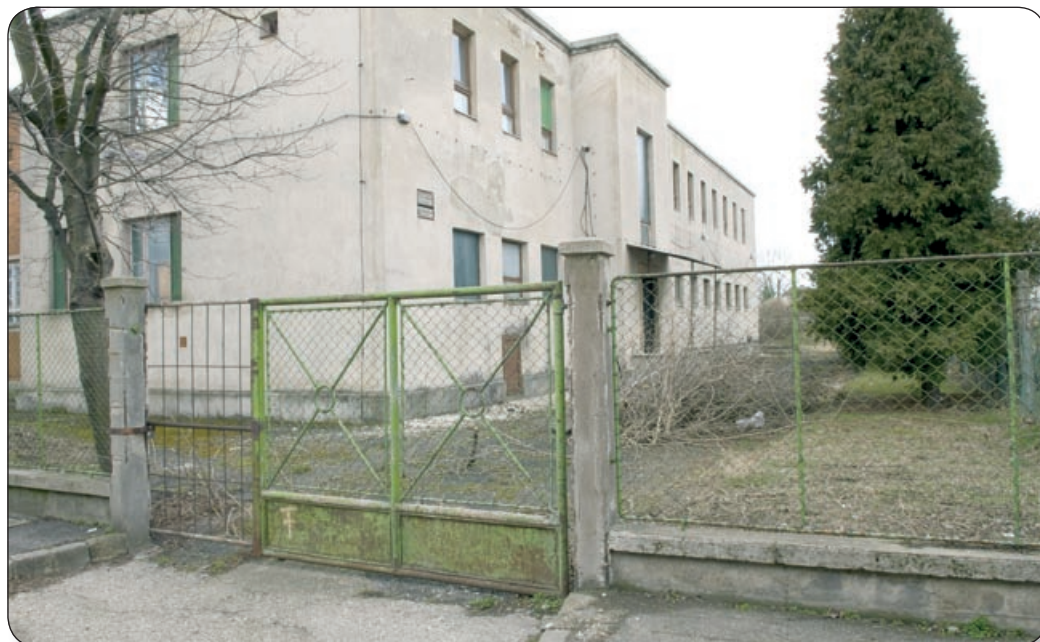
A RÉGI BANYARENDELŐ ÉPÜLETE. ÚJ MUNKAHELYEK LÉTESÜLHETNEK ITT IS