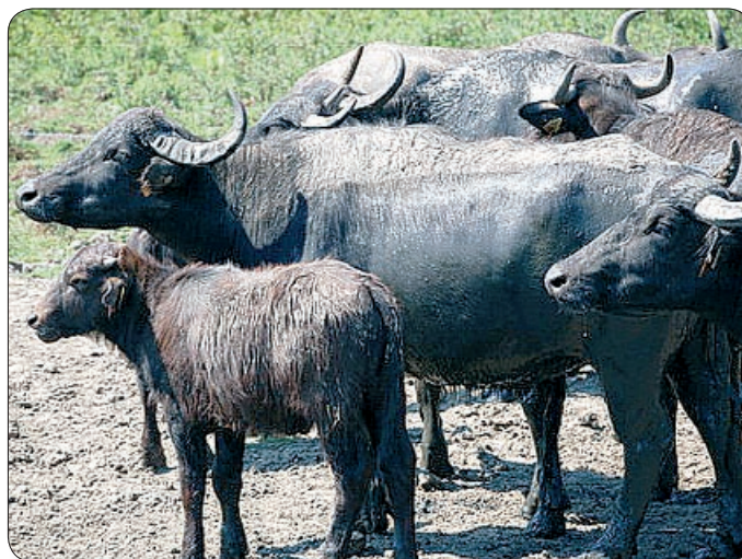
A BIVALY HASZNOSÍTÁSA IGAVONÓKÉNT VOLT JELENTŐS

Magyarországon a bivalyt a 16. század óta tenyésztik. A történelmi Magyarországon 1911-ben 155 192 bivaly élt. Elsősorban a mai Somogy és Zala megye nehezen járható, nedves, sáros területein használták ki munkaerejét. A II. világháború előtt még Mezőhegyesen is volt egy értékes bivalytenyészet. A II. világháború utáni évtizedekben a bivaly tenyésztése a Kárpát-medencében szinte teljesen megszűnt. Napjainkban alig néhány tucatnyi állat őrzi a hajdani magyar bivalyállomány emlékét. A bivalytehenek kétharmada főleg a Balaton-felvidéki és a Fertő-Hanság Nemzeti Park területén található meg. A kápolnapusztai bivalyrezervátum Magyarországon