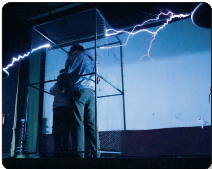
FIZIKA TESTKÖZELBEN. AZ ÖNKÉNT JELENTKEZŐK ÉRDEKES KÍSÉRLETNEK LEHETNEK RÉSZESEI