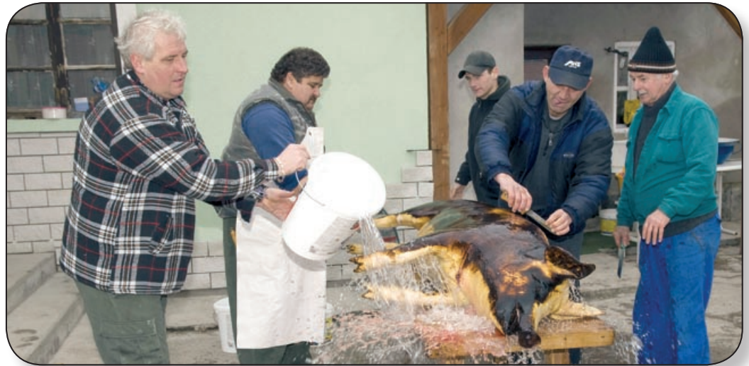
MA MÁR SAJNOS, EGYRE KEVESEBB AZ IGAZI DISZNÓVÁGÁS

Inota faluban télidőben azért hallani innen-onnan, hogy disznóvágást tartanak, bár mára a hűtőszekrények, fagyaszók elterjedésével nem csak a fagyos, hideg idő alkalmas a sertés feldolgozására. Sok esetben ma már nem a saját, házilag felnevelt hízót vágja le a család, hanem megvásárolja valamelyik tenyésztőtől. A faluban is élnek olyan gazdák, akik foglalkoznak sertéstenyésztéssel, bár egyre kevesebben, így vannak, akik a környező falvakból vesznek