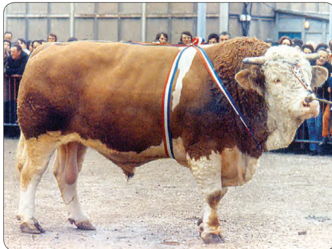
A MAGYAR TARKA ŐSHONOS ÁLLATUNK, MÉGIS CSAK A MÚLT SZÁZADRA VÁLT ELTERJEDT FAJTÁVÁ

A magyar tarka szarvasmarha, vagy régebbi elnevezésével magyar pirostarka egyike őshonos, védett háziállatainknak. Színe sárga-piros-tarka. Élénk, jóindulatú állat. Átlagosan 607 kg élőtömegű, a tehén 600-700 kg, a bika 800 kg. A 19. század első felében a kimonodottan hústermelő marhának számító magyar szürkemarkarha helyett igény jelentkezett egy elsősorban tejtermelő szarvasmarhafajta iránt. A döntő fordulatot a dualizmus kora hozta, amikor fokozódott a kereslet a tej és a tejtermékek, és ezzel a korszerű, jobb termelőképességű, igényesebb fajták iránt. Ekkor még az állomány több mint 90%-át tette ki a szürkemarkarha, amely részt vett a magyar tarka kialakításában.