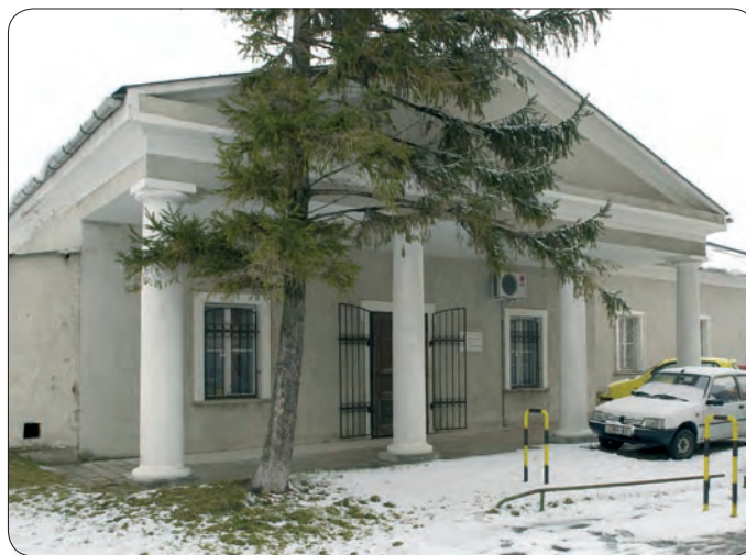
A MEGYEHÁZA ÉPÜLETE. ÖTSZÁZ FORINTNÁL AZÉRT TÖBBET ÉRT...

A korábbi városvezetésnek hála a Megyeház sincs már önkormányzati tulajdonban. 500 forintért vásárolta meg a Hit Gyülekezet,