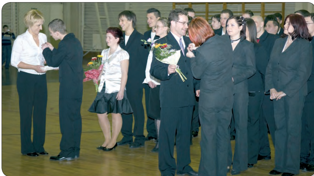
A VÁRPALOTAI FALLER JENŐ SZAKKÉPZŐ ISKOLA ÉS KOLLÉGIUM HÉT VÉGZŐS OSZTÁLY DIÁKJAINAK SZALAGAVATÓ ÜNNEPSÉGÉRE A GÁL GYULA VÁROSI SPORTCSARNOKBAN KERÜLT SOR.