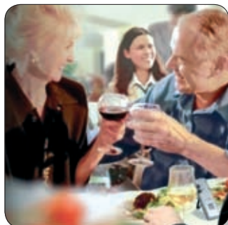
ADJUNK VISSZA OLYAT, AMI MINDENNÉL TÖBBET ÉR: SZÜLEINK ÖSZINTE MOSOLYÁT

Az ünnepek közeledtével mindannyian egyre többet gondolunk szeretteinkre, s szeretnénk nekik örömet okozni. A legtöbben ki is választottuk már, hogy kinek mit szeretnénk ajándékozni, s reméljük, hogy a fa alatt állva boldog arcok vesznek majd körül bennünket. Ilyenkor összegyűlik a család apraja-nagyja, hogy együtt töltsék a szentestét. Sajnos gyakran előfordul, hogy nem felhőtlen a boldogság, mivel a szülők, nagyszülők sokszor nem tudnak teljes értékűen részt venni a családi társalgásban, és csendben ülnek az asztalnál. Hogy miért? Mert halláscsökkenéssel kell együtt élniük, és lassan elcsendesedik körülöttük a világ. Ha feltesszük magunknak a kérdést, hogy mit is tehetnénk azért, hogy szüleink, nagyszüleink is boldogan beszélgessenek, sokszor nem is jut eszünkbe a legkézenfekvőbb