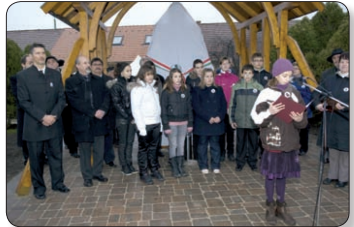
AZ ÜNNEPSÉGEN A RÁKÓCZI-TELEPI TAGISKOLA DIÁKJAI ADTAK TARTALMAS MŰSORT

December 6-án, a várpalotai katolikus templomban folyt tovább a Szent Borbála-napi megemlékezés,