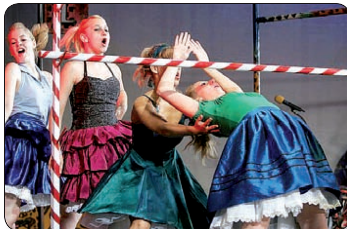
JAMPIBULIVAL BÚCSÚTATJÁK AZ ÉVET A RETRO SZÍNHÁZBAN

A legenda most életre kel, az álom valósággá válik, és a darabban semmi más nem számít, csak a jókedv, a szerelem, a zene, a rocky, a rumba, a csacsacsca, a twist, a csinos lányok, a remek ritmusok, a pepita napszemüveg, a hajlakk és a rágógumi. Álmaink netovábbja, az örökké rikító szívárványszínen