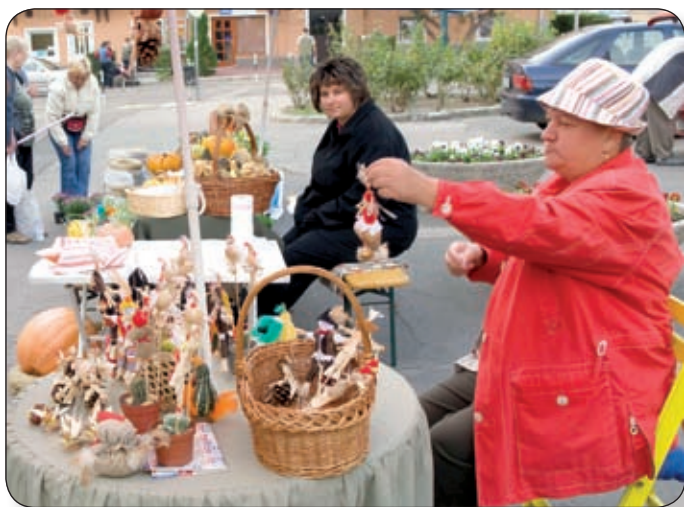
NEMCSAK BIO-, HANEM KÉZMŰVESTERMÉKEK IS VOLTAK A VÁSÁRON