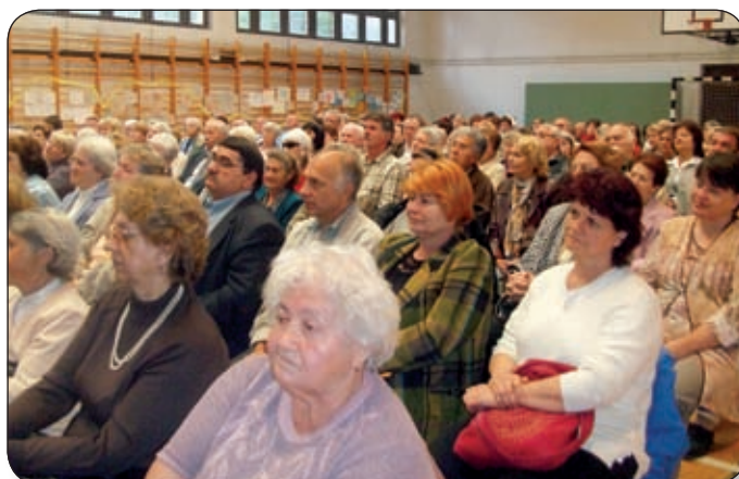
NAGY ÉRDEKLŐDÉS NYILVÁNULT MEG AZ ELŐADÁSOK IRÁNT

Olyan orvos előadók szólaltak fel, akik szakmai téren nagy elismertséggel rendelkeznek, országosan ismertek és köztiszteletnek örvendenek. A szuggesztív előadások vezérfonalként hatottak a hallgatóság gondolataiban, vezetve, irányítva azt a szív útján. Hallhatóak voltak történetek, vélemények a test vonatkozásában orvosi szempontból, a tudomány szemszögéből, sokszor humorral fűszerezve, de minden esetben összekötve a lélek világával. A természetfeletti szempont is erőteljesen megjelent: Isten, aki gyógyít, teremt, élet és halál ura.