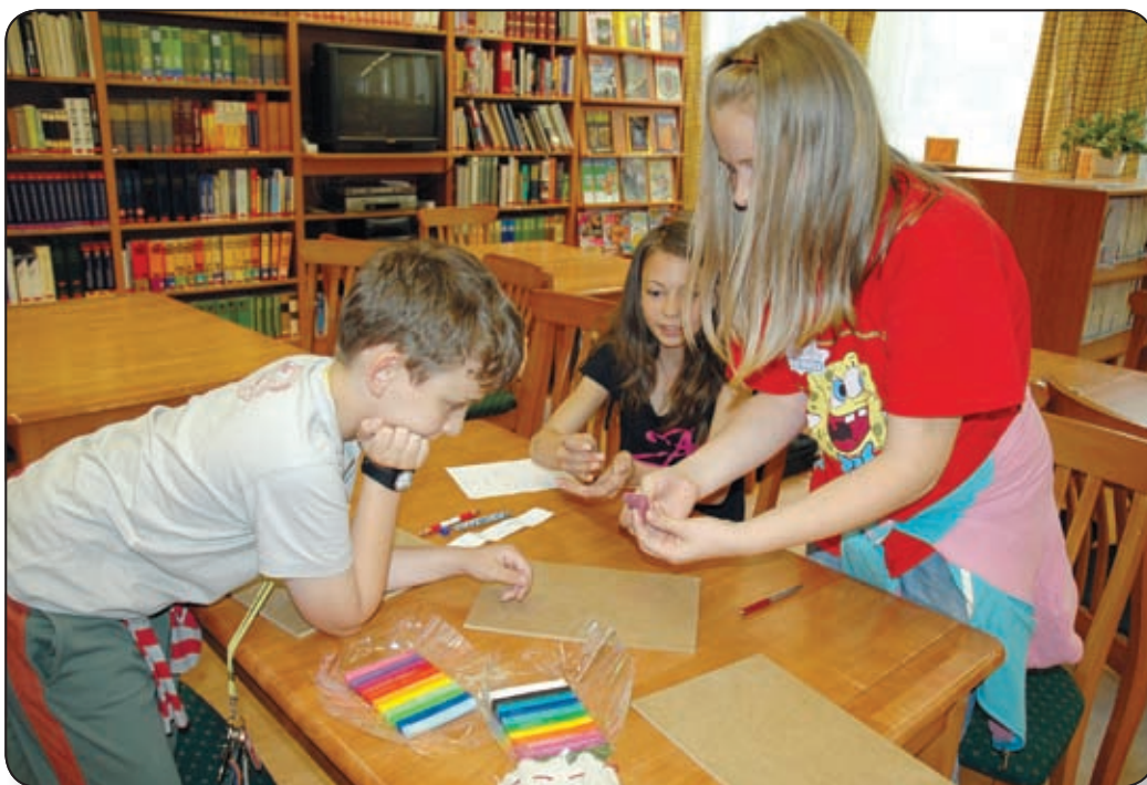
VÁRPALOTA VÁROS ÖNKORMÁNYZATA TÁMOGATJA A RÁSZORULÓ ISKOLAKEZDŐKET

Várpalotán néhány iskolában már átvehették a tankönyvcsomagot az új tanévre, ám a legtöbb helyen még várat magára a könyv-