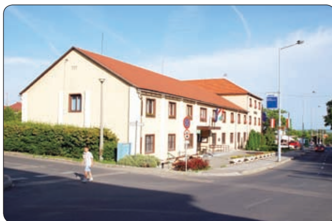
A VÁRPALOTAI VÁROSHÁZA