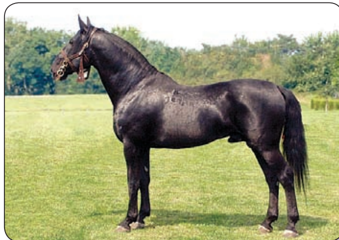
A NÓNIUSZ NYUGODT VÉRMÉRSÉKLETŰ, TARTÓS TELJESÍTMÉNYRE KÉPES

Külleme: A fajta származását tekintve tömeges angol félvér a melegvérű igás lófajták egyik