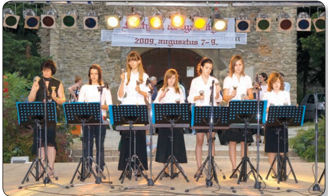
A ZENEISKOLA TANÁRAI ÉS DIÁKJAI GYÖNYÖRŰ RENESZÁNSZ DALLAMOKAT CSALOGATTAK ELŐ HANGSZEREIKBŐL

Furulya, csörgő szerves része volt a kor zenéjének, a három nap alatt többször is élvezhették az érdeklődők a különféle zenei programokon keresztül. A megnyitón és a záró délutánon is felléptek a zeneiskola tanárai és diákjai gyönyörű dallamokat kicsalogatva hangszereikből, a zene mellett pedig a reneszánsz tánc és ruházat adta meg a hangulatot a III. Béla Lovagrend bemutatójában.