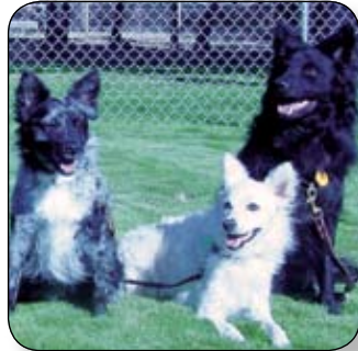
A MUDI IGAZI TERÜLETE A PUSZTA