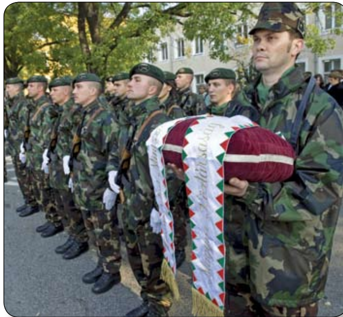
A NEMZETI ÜNNEP ALKALMÁBÓL SZALAGOT KAPOTT A BAKONY HARCKIKÉPZŐ KÖZPONT