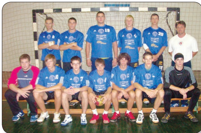
A VÁRPALOTAI BÁNYÁSZ TAVALYI IFJÚSÁGI BAJNOKCSAPATA

A mai helyzet az akkorinál jóval speciálisabb: a demográfiai helyzetnek megfelelően jóval kisebb a gyermeklétszám, a sport már nem olyan vonzó alternatíva az iskolai foglalkozások után, főleg a multimédiás eszközök, amit szívesebben választanak a gyerekek, mint a sokszor az igen fárasztó edzéseket. Egyre több azok száma is, akik általános felső tagozatába már úgy kerülnek fel, hogy teljesen be vannak oltva a testedzés ellen, nem-hogy délutáni sportfoglalkozást nem vállalnak, hanem még a test-