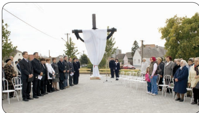
MAGYARORSZÁG ELSŐ KULÁKEMLÉKMŰVÉT AVATTÁK VÁROSUNKBAN

Több százan voltak érintettek a palotaiak közül a kulákküldözésekben, a polgáriak közül mintegy 9 családot, 32 főt deportáltak. Szép számmal vannak azok is, akik a retteget kort nem élhették túl, megölték, agyonverték, halálra kínnozták őket az ÁVO-sok.