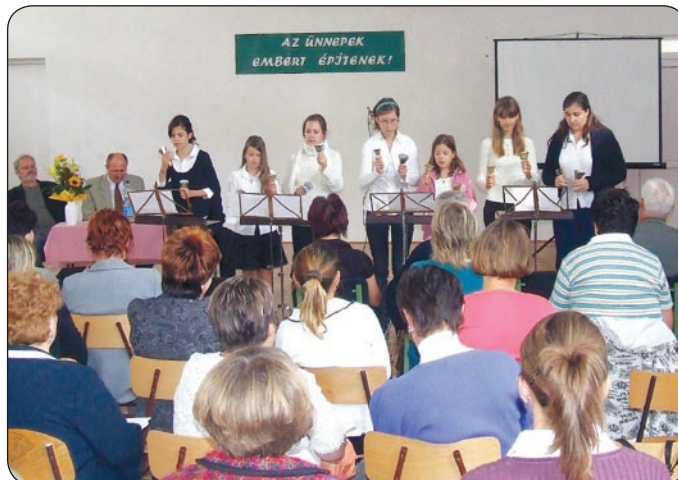
KEDVES SZÍNFOLT VOLT A ZENEVÁR ISKOLA NÖVENDEKEINEK CSENGETTYÚS ELŐADÁSA

A legutolsó nap már a szakmai továbbképzésnek szólt. A Zenevár iskola növendékeinek csengettyús