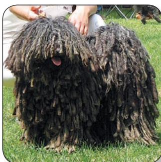
A LEGISMERTEBB MAGYAR KUTYAFAJTA

Pásztorkodó őseink ősi terelő-kutyája. A világon a legismertebb és a legelterjedtebb magyar kutya-fajta, igazi hungarikum. Nem kell messzire menni, a napokban a hazánkban megrendezett Európa-kiállításra is a puli volt a „címerkutya”. A pulit a régi világban a munkája alakította, aki tartotta egyszer, annak sosem kellett más kutya. Oldalakat lehetne írni a magyar puli sokoldalúságáról és jó tulajdonságairól, de sajnos területi korlátok miatt ezt itt most nem lehet megtenni. Egy rendkívül értelmes, éber, jó természetű, jól dolgozó, igénytelen, gazdájához végletekig ragaszkodó fajtáról van szó, mely jó tulajdonságai miatt az egész világon kedvelik és nagy számban tartják.