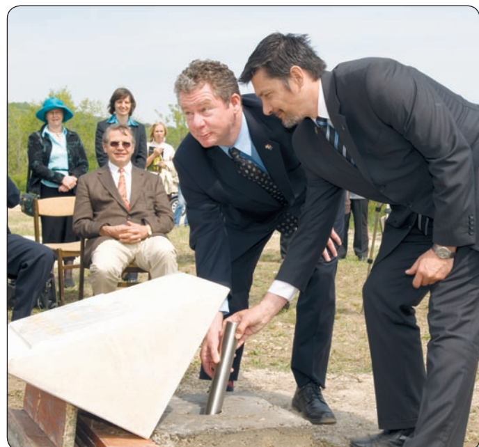
A VÁROSVEZETÉS LEGFONTOSABB SIKERE AZ ÚJ-ZÉLANDI AHI ROOFING CÉG EGYETLEN EURÓPAI GYÁRÁNAK VÁRALOTÁRA TELEPÍTÉSE

új bölcsődék, a családtámogatási program, a sok út- és járdaépítés és -felújítás, valamint a városi társasház-felújítási program. Nagy eredménynek tartom, hogy a városi beruházásokba a korábbiaknál sokkal nagyobb arányban tudtunk bevonni helyi vállalkozókat. Jó példa erre a hamarosan induló bér-lakásépítés, melynek 250 000 000 Ft-os munkáit mind palotai vállalkozóknak akarjuk megszerezni.