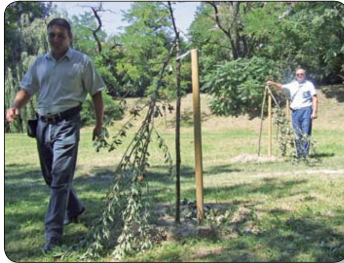
A KÖZTERÜLET-FELÜGYELET IGAZGATÓJA ÉS MUNKATÁRSA VIZSGÁLODÍK A HELYSZÍNEN

mutatták be egymásnak, miként lehet a fiatal csemetéket könnyen elpusztítani. Az unatkozó társaság hasonló jellegű megmagyarázhatatlan rongálást követett el akkor is, amikor 2008. január 19-