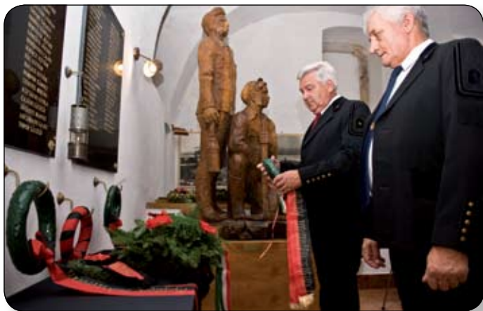
ÁHALÓLOS BALESETET SZENVEDETT Bányászok EMLÉKTÁBLÁJÁNÁL SZERVEZETEK ÉS MAGÁNSZEMÉLYEK HELYEZTÉK EL A TISZTELET KOSZORÚJÁT

Ötvennyolcadik alkalommal került megrendezésre városunkban a bányásznap ünnepség múlt szombaton.