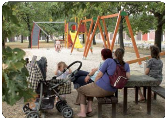
PALOTÁN AZ IDEI ÉVBEN 30 MILLIÓ FORINTBÓL ÉPÍTETEK JÁTSZÓTEREKET

Árpádtól megtudtuk, hogy a város vezetése kétéves koncepciót készített, melyet ha jövőre befejeznek, minden városrész ellátott lesz modern játszótérekkel. A nagyobbak igényeit is szeretnék kielégíteni, hiszen a megépült játszótérek elsősorban a gyerekeknek készültek. 12 éves kor felett igazából nem is sza-