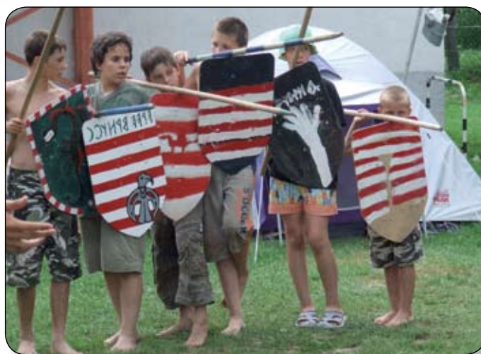
A JÁSDI TÁBORBAN A GYEREK SAJÁT KÉSZÍTÉSŰ PAJZSOKKAL VETEK RÉSZT A HADI JÁTÉKBAN

Amellett, hogy rengeteget gyakorolnak, edzenek, gondot fordítanak arra is, hogy megismertessék és megszeretessék az ifjúsággal őseink életmódját, harcmódját, s mindezt élvezetes, izgalmas módon. Az Őrzők Rendje Hagyományörző Egyesület most augusztus derekán rendezte meg haditáborát Jásdon, vadregényes környezetben, a Gaja patak mentén. Itt általános és középiskolás korúak ismerkedhettek meg az íj-, nyilvessző-, pajzs- és alkarvédő-készítéssel. Megtanulták a bot- és ostorforgatás rejtjelmeit, éjszakai harci túrán vet-