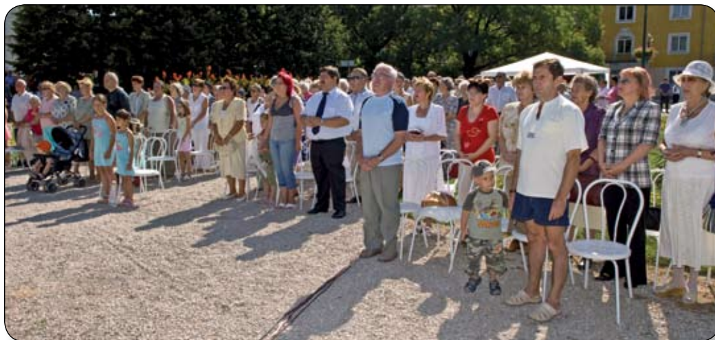
SZÉP SZÁMBAN GYŰLTÉK ÖSSZE A VÁRPALOTAIK A THURI-VÁR ELŐTT