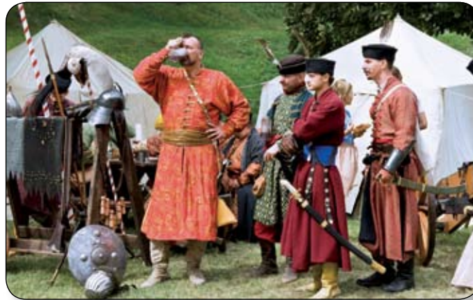
A VÁROSTROM UTÁN IGENCSAK JÓLESETT A KUPA BOR A MAGYAR VITÉZEKNEK

A szombati napot a múzeumi hangja indította, mely a török tá-