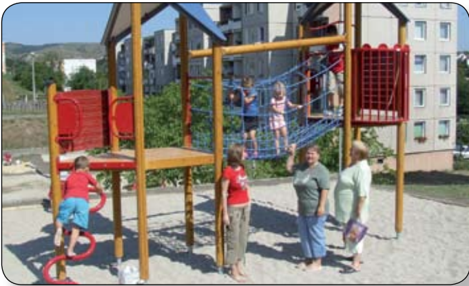
A JÁTSZÓTEREKET MÁR NAGY ÖRÖMMEL VETTÉK BIRTOKBA A GYEREKEK