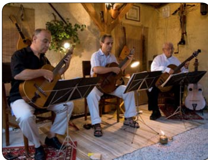
A PHOINIX EGYÜTTES A TITKOS KERTBEN

– Az együttes zenei ízlése elég nyitott, így a hangversenyeken általában rendkívül színes zenei palettáról válogathatunk, így pedig különböző irányzatok köszön-