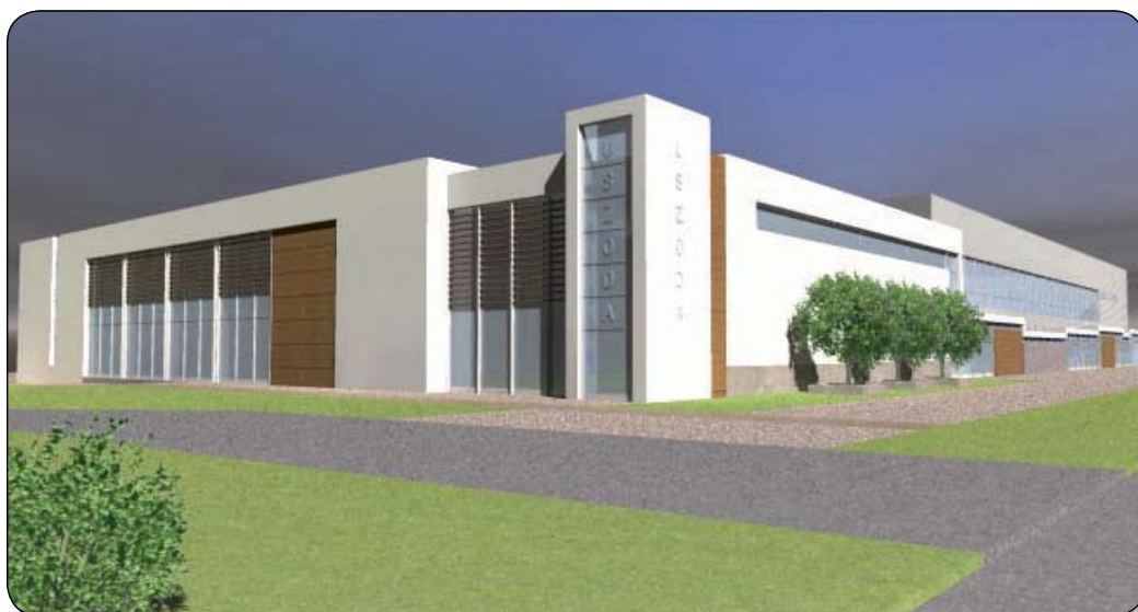
AZ USZODA LÁTVÁNYTERVE

Nemrég felmerült az igény egy saját, palotai uszoda építésére, ami kapcsán a PPP programban már elkészült egy tervezet, de ebben nem tudtak a döntés hozók győztest hirdetni, ezért új megoldás után kellett nézni. Eszerint a Várpalotai Közülemi Kft. és a Várhő Kft. testületi jóváhagyással tökeemlést hajtott végre, és saját beruházásként építi fel az uszodát. A tervdokumentációra és az engedélyeztetésről szóló közbeszerzési pályázat