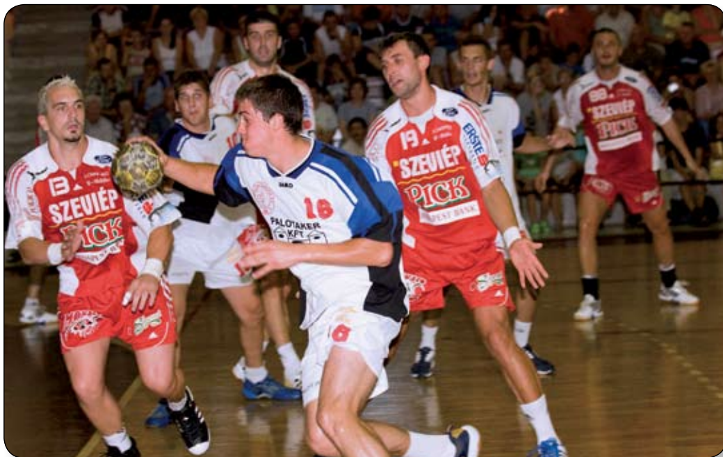
VÁRPALOTAI AKCIÓ A SZEGEDI KAPU ELŐTT

Várpalotai sportcsarnok. Néző: 700. Játékvezető k.: Horváth, Jancsó. Kiállítás 2/– Hétméteresek: 2/1, 0/0.