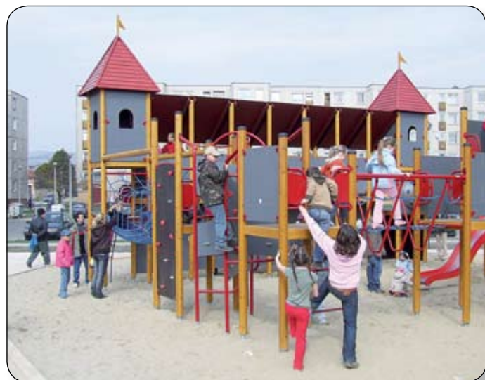
A JÁTSZÓVÁR MEGFELEL AZ EURÓPAI UNIÓS ELŐÍRÁSOKNAK

számolni, mint játszótérekben, mivel Várpalotán is több elszórt, egyedülálló homokozó és hinta van, mint teljes játszótér. Minden egyes elemet meg kell vizsgálnunk több szempontból is, és adott eset-