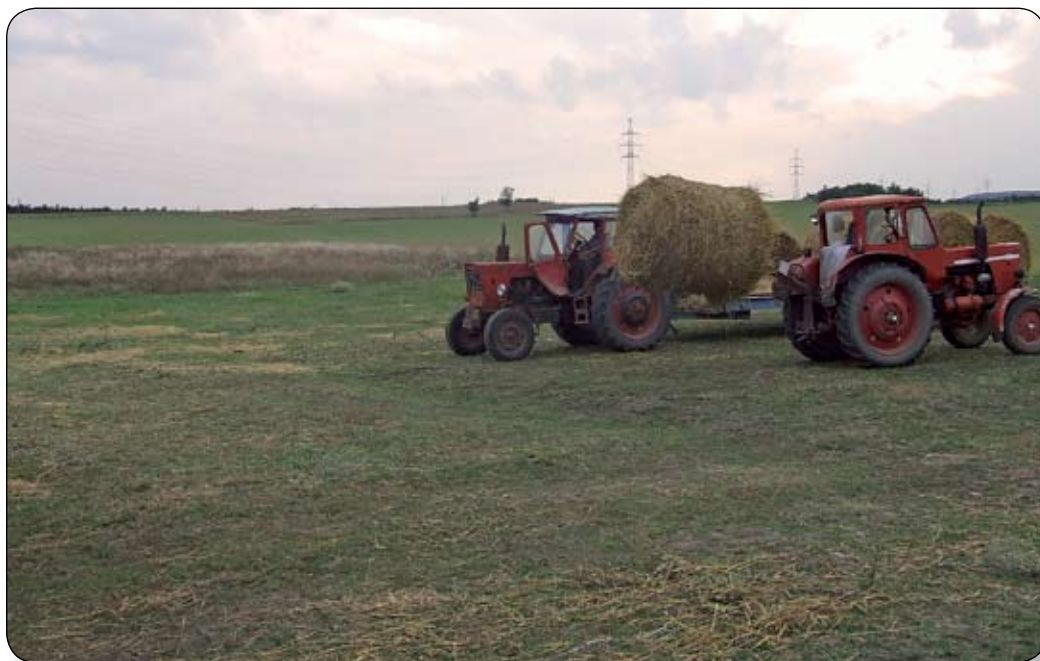
A MAGYAR GAZDA MOST MÉG SAJÁT FÖLDJÉN DOLGOZIK. KI TUDJA MIT HOZ A JÖVŐ?