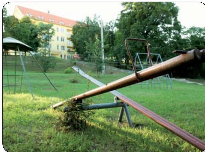
CSAK A MEGFELELŐ JÁTSZÓTEREK MARADHATNAK MEG

minden városrészbe jut egy-egy új játszótér, illetve a sűrűbben lakott Tési-dombrán is. A napokban indul az építkezés, és lényegében egyszerre fognak elkészülni. Egy svéd játékelemgyártó cég magyar