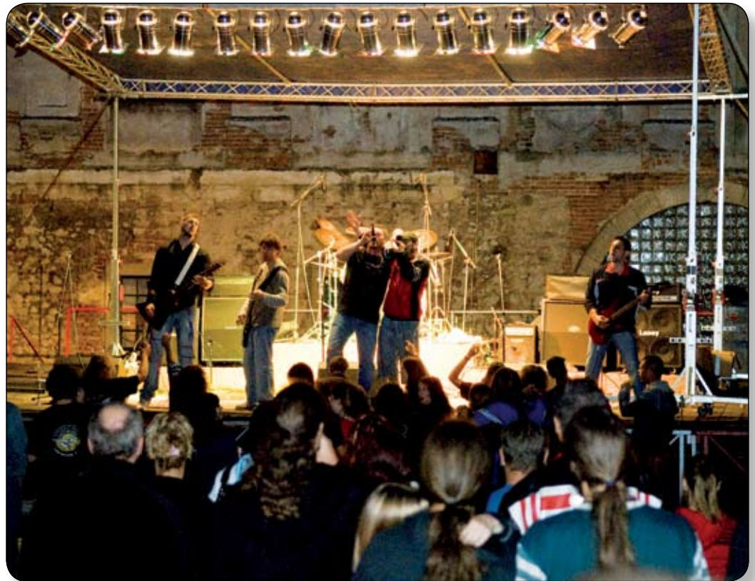
A BÁTÁRKÉ VOLT A SZERENCSE. AKIK A ROSSZ IDŐ ELLENÉRE ELJÖTTEK, JÓ ZENÉKET HALLGATHATTAK. SZÍNPADON A GATE EGYÜTTES

Az elsőként fellépő Hátsó Gondolatnak hálátlan szerep jutott: a kiadós zuhé után a vár körül, a városban ögyelgőket kellett a jófajta rockzenéjükkel idecsalogatniuk, és a bártortalanul beóvakodókat ittmarasztalniuk. Ez sikerült is nekik, s a műsoruk végére már előre is mérészkedtek jó néhányan, érezve a rock jótékony vérpezsdítő hatását. Az utánuk következő, rhythm&blues zenét játszó Blues Karaván a már megalapozott hangulatot tovább fokozta. Ez nem volt nehéz egy