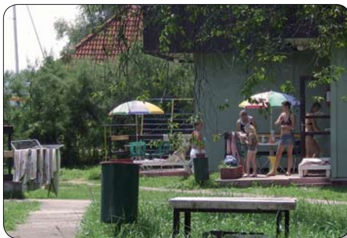
A PÉTFÜRDŐKNEK NEM KELLETT A BALATONFÜZFŐI ÜDÜLŐ

Pétfürdő képviselő-testülete 600 millió plusz járulékai igénygeléssel lépett fel, s ezen összeg megfizetésével lezártnak tekintené az osztozkodást. A város vezetése nem látott jogalapot a követelés teljesítésére, de egyébiránt kompromisszumos ajánlatot adott: A képviselő-testület egyhangúlag úgy döntött, felajánl százmillió forint készpénzt + a jövedelemtermelő képességgel rendelkező