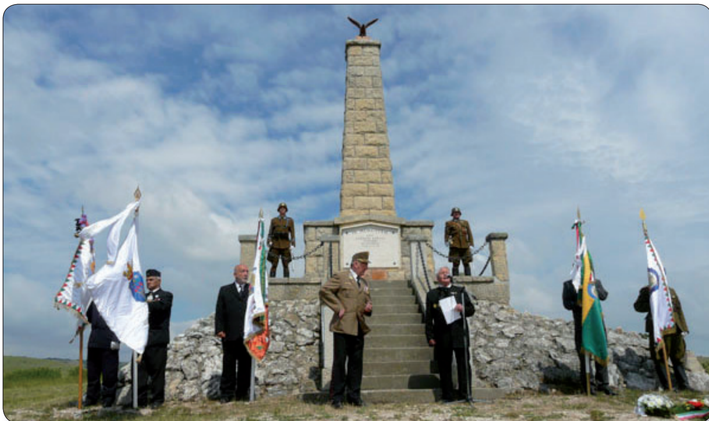
ÚJRA A TURULMADÁR ŐRZI A HŐSI HALÁLT HALT KATONÁK ÖRÖK ÁLMÁT

Nyolcvan évvel a tragikus baleset után újra áll a turulmadár Várpalotán a hegytetőn, hogy emlékeztessen az ősi magyar múltra, a trianoni diktátumra és azokra a katonákra, akik 1928-ban a magyar haderő újrászerveződése során egy titokban kifejlesztett ágyú kipróbálásakor haltak hősi halált.