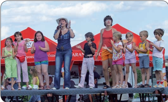
A GYEREKEK IS JÓL SZÓRAKOZTAK A MULATSÁGON

A Baglyasi Társulat Egyesület július 19-én, szombaton Baglyas-napi juliálist rendezett a baglyasi Bokodi-pince mellett, ahol színes programokkal várták a várapalotaiakat és a környékeket.