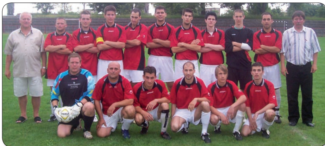
A VÁRPALOTAI BÁNYÁSZ SK LABDARÚGÓCSAPATA MEGKEZDTE A FELKÉSZÜLÉST AZ ŐSZI IDÉNYRE

A rutin hiánya és a sérülések miatt jó pár pontot elhullatott a csapat. Ebből adódóan sajnos néhány hazai vereség is becsúszott. Az utolsó fordulóban viszont sikerült szurkolóikat kárpótolni, mert nagyarányú győzelemmel búcsúztak a bajnokságtól. A szakvezetés szerint erre az együttesre lehet építeni, ezért mindent megtettek, hogy együtt tartsák a tavalyi csapat tagjait. Ez nem volt egyszerű dolog, mert az egyesület legjobbait több