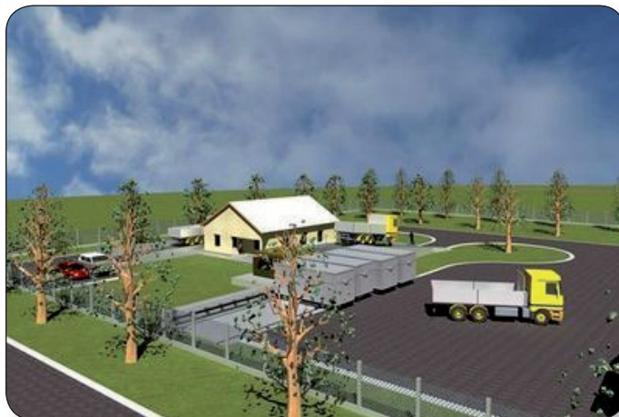
KÉT ÉVEN BELÜL AZ ORSZÁGBAN EGEDÜLLÁLLÓ TECHNOLÓGIÁVAL RENDELKEZÜNK MAJD

kormányzatok társulásként önálló jogi személyként lépjenek fel. Az Észak-balatoni Hulladéktársulásnak Várpalota és környéke tehát már nem tagja, mert a közép-dunántúli, hasonló kondíciókkal rendelkező