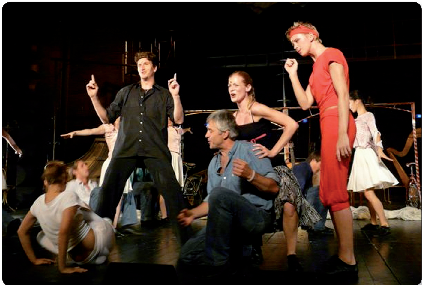
A BOLDOG IDŐ TALÁN AZ UTÓBBI IDŐK EGYIK LEGNAGYOBB SZÍNPADI VÁLLALÁSA

Várpalotán is bemutatta a Pannon Várszínház a Boldog időt