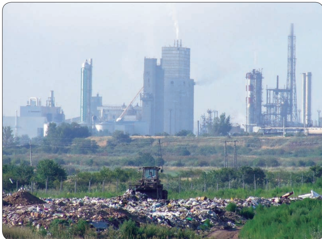
A VÁROSI SZEMÉTELEP NEMSORÁRA MEGTELIK

más-más fokon eltérő ítélet született. De ez egy másik történet. Végül is Szentgál elfogadhatónak látszott első körben. Könnyen megközelíthető, barnamezős ipari terület volt a helyszín. A település ekkor a figyelem középpontjába került. Megtartották a népszavazást, ahol a döntő többség igent mon-