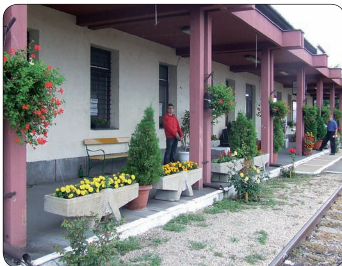
GYÖNYÖRŰ FUTÓMUSKÁTLÍK, RÓZSÁK ÉS MÁR VIRÁGOK TESZIK AZ ÁLLOMÁSÉPÜLETET VONZÓVÁ

Az állomás mögötti területen nem volt ennyire rózsás a helyzet. Bokrok, szemétkupacok, dzsumbuj jellemezte az út és a volt bányaterület közötti szakaszt. Ez idáig.