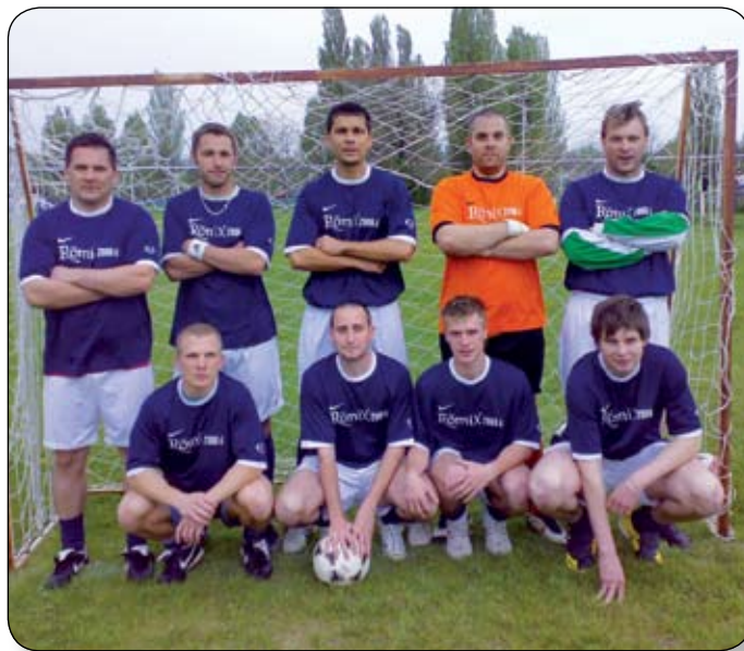
A BAD BOYS BLUE CSAPATA A MÁSODIK HELYEZETT A BAJNOKSÁGBAN

Érdekesség, hogy a teremlabdarúgó bajnokság után a szabadtéren is alakult egy szenior csoport, ahol bár a játék sebessége már nem 10 évvel ezelőtti, de nagyon szikrázó, és magas színvonalú derbiket lehet látni a „Bányász-pályán”. Mindegyik csoportban befejeződött az első kör, minden csapat túl van összes ellenfelén, szeptemberben következnek a visszavágók.