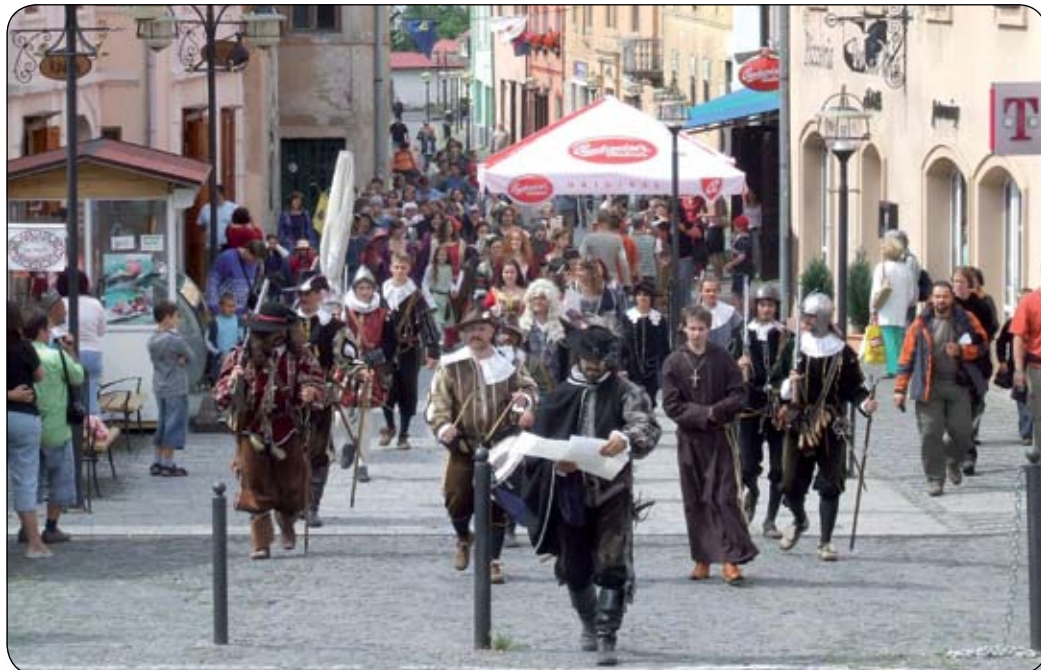
SZÍNPOMPÁS FELVONULÁS KORHŰ RENESZÁNSZ JELMEZEKBE A VÁROS UTCÁIN