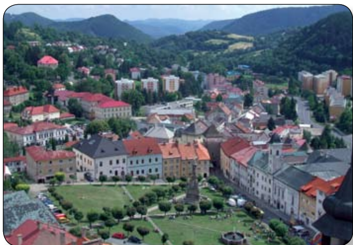
KÖRMÖCBÁNYA LÁTKÉPE A FÖTÉRREL