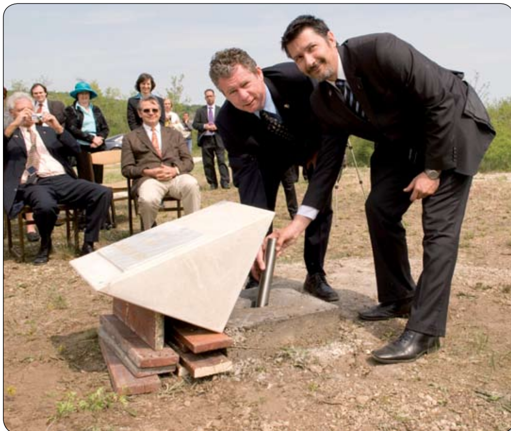
ALAPKÖVETÉTEL AZ INOTAI IPARI PARKBAN. TÖBB MINT SZÁZ MUNKAHELY LÉTESÜL