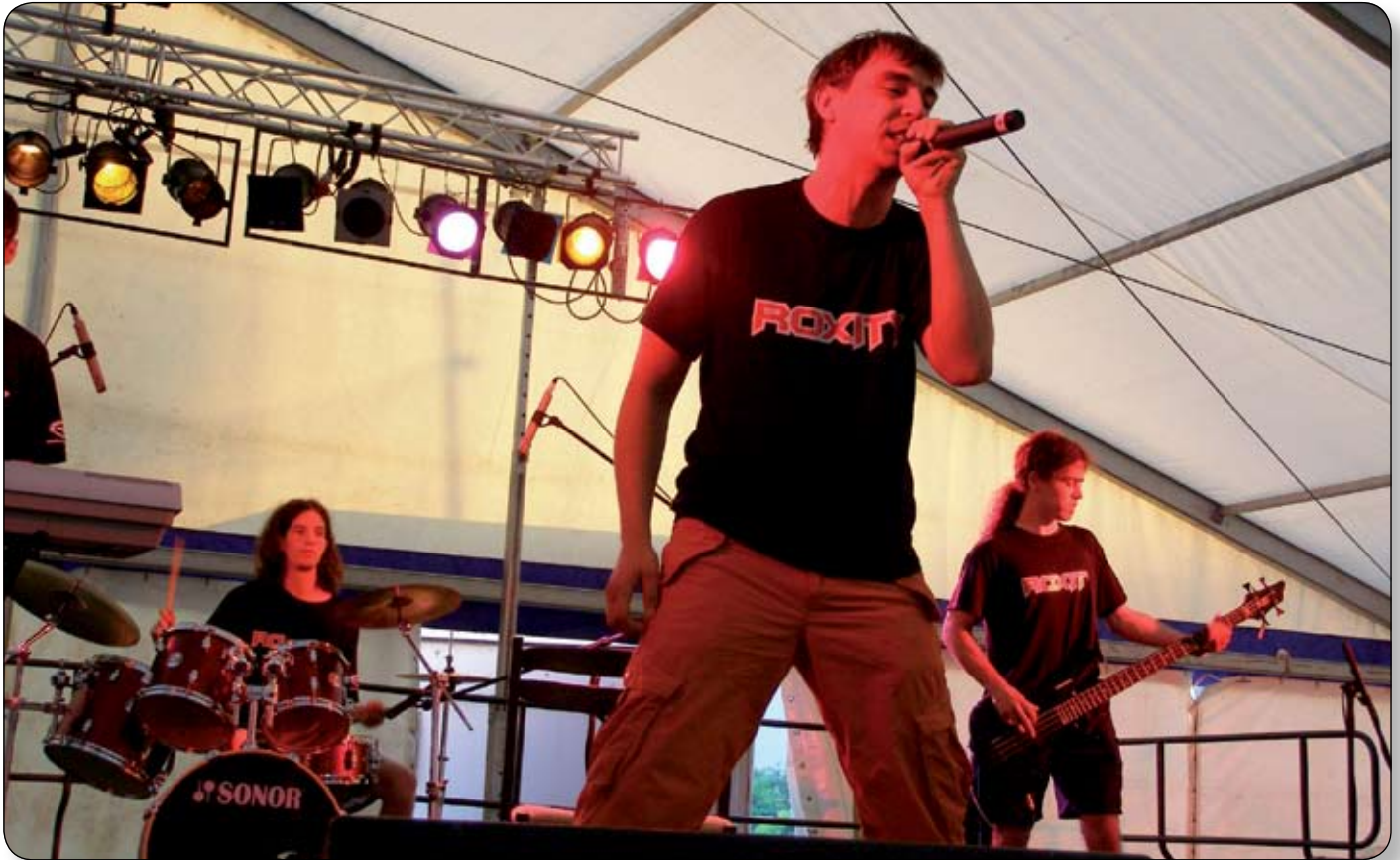
AKCIÓBAN A ROXITY ZENEKAR

Otthagyta a színtanodát, hogy játszhasson