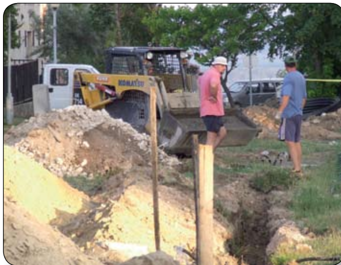
MUNKÁLATOK A TÉSI-DOMBI SPORPÁLYÁNÁL. AUGUSZTUSBAN MÁR ÚJRA HASZNÁLHATJUK

Megállapodást írtak alá az olasz Grottazolina várossal, amely szerződés felhasználható arra is, hogy uniós pályázatokon együtt tudjon a két város indulni. A Várpalota és Grottazolina már régóta kapcsolatban van a