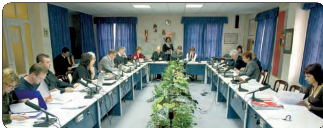
A KÉPVISELŐK VÉLEMÉNYEZTÉK A VÁROS JÖVŐ ÉVI KÖLTSÉGVETÉSI KONCEPCIÓJÁT

lesz, mint a 2008. majd a 2010. évi. Egyes képviselők szerint vannak olyan költségvetési tételek, amelyekre az önkormányzatnak kevesebbet kellene előirányoznia. Ellenvélemények hangzottak el arról, hogy mennyiben kell a helyi megszorításokat a kormányrendeletekkel kapcsolatba hozni, a „nagypolitikát” bevonni. A képviselő-