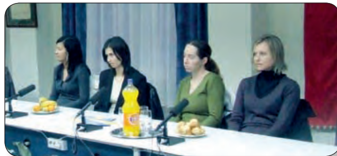
PÁLYAKEZDŐ, IFJÚ PEDAGÓGUSOK

gondolatokat adtak át útmutatásként, a „követek, mert tisztellek”, a gyermekek szeretete, a méltóság-