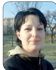
Eged Krisztiánné gyesen lévő anyuka

Nagyon fontos számunkra a karácsony, ilyenkor az egész család összegyűlik. Előtte örömmel készülünk az ünnepre, már feldíszítettük az ablakokat. Három kisgyermekünk pedig már nagyon várja a Mikulást is.