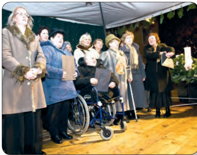
A FŐTÉREN FELÁLLÍTOTT SZÍNPADON ZENEI PROGRAMOK TETTÉK EMLÉKEZETESSÉ AZ ÜNNEPNAPOT

A város központjában vasárnap este fénybe öltözött a Thuri-vár és a tér. Ez a koszorú legyen a kará-