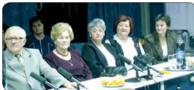
VÁROSUNK SZÍNES DIPLOMÁS PEDAGÓGUSAI

keiket, élettörténetüket osztották meg a már évtizedek óta a pályán lévő tanárok a jelenlévőkkel, szeretettel és szívesen adták át jó tanácsaikat, biztatásaikat a fiatal kollégáknak. Kifejezték, hogy a folyamatos tanulás, a türelem, a kitartás, a kisgyerekek élményhez való juttatása a nehézségek ellenére is elengedhetetlen ezen a szép pályán. Több évtized alatt megélt vezér-