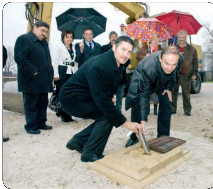
JÖVŐ NYÁRRÁ ELKÉSZÜL AZ USZODA

Várpalotán már létesült uszoda, melyet 1935-ben Csík Ferenc avatott fel, majd itt készült az 1936-os berlini olimpiára a gyorsúszó