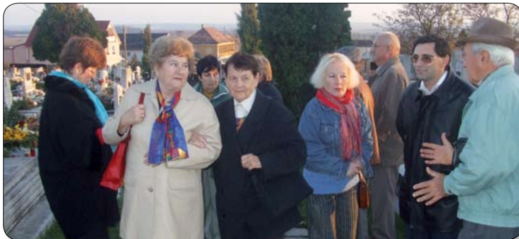
A VÁROSSZÉPÍTŐ ÉS -VÉDŐ EGYESÜLET TAGJAI TÖRTÉNELMI EMLÉKHELYEKET TEKINTETEK MEG

A református templom 1786-ban épült fel. Addig is létezett református gyülekezet Inotán, az első jegyzett lelkész Megyeri Dániel volt 1696-ból, de igazán az 1760-as években idemenekült magyarpolányi hívek által erősödött meg az eklézsia. A magukkal hozott ha-