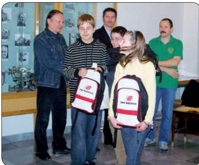
A GYEREKEK A GYŐZELMEN KÍVÜL ÉRTÉKES AJÁNDÉKOKNAK IS ÖRÜLHETTEK